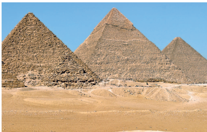
Три великие пирамиды

Одной из самых притягательных «достопримечательностей» Египта является Красное море с огромным разнообразием подводной флоры и фауны. У берегов Египта на небольшой глубине лежат затонувшие корабли, которые принесли стране мировую известность среди дайверов. Именно здесь многие россияне впервые погрузились в море с аквалангом или встали на серферскую доску.