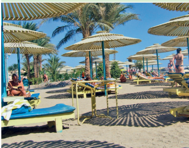
Пляж Красного моря