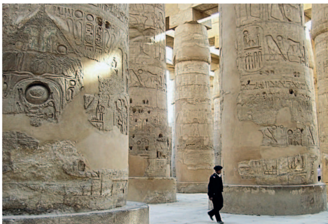
В Карнакском храме