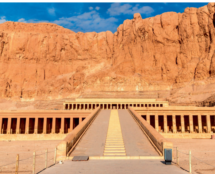
↓ Луксор. Храмовый комплекс Хатшепсут