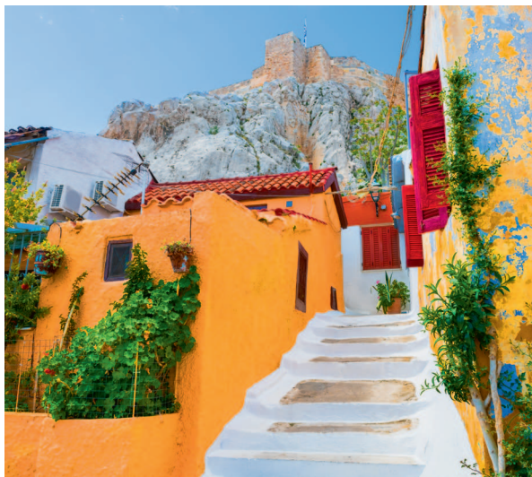
↑ Живописная греческая архитектура в районе Плака

Где можно ощутить дух Афин? Не только в Акрополе, но и на Агоре, впечатляющем древнем рынке. Агора прежде была экономическим центром жизни города, и здесь же проходили общественные собрания, диспуты, празднества и некоторые представления. Сегодня эта площадь окружена зданиями. На Агоре достойны особого внимания Храм Гефеста, а также руины библиотеки Пантаиноса и Одеона Агриппы, которую использовали для философских лекций.