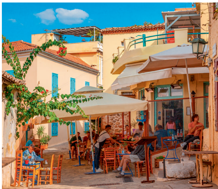
↑ Ресторан на афинской улочке

Посетителям Афин стоит учесть, что в городе очень знойное лето, поэтому потребуются солнцезащитные кремы и головные уборы. Чтобы быстрее адаптироваться к жаре, важно пить много воды. В Афинах принято оставлять чаевые в ресторанах и кафе — обычно 5–10 % от суммы счета. Не забудьте приобрести транспортную карту для передвижения по городу и изучите расписание транспорта, чтобы экономить время и деньги.