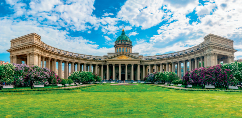
↑ Казанский собор