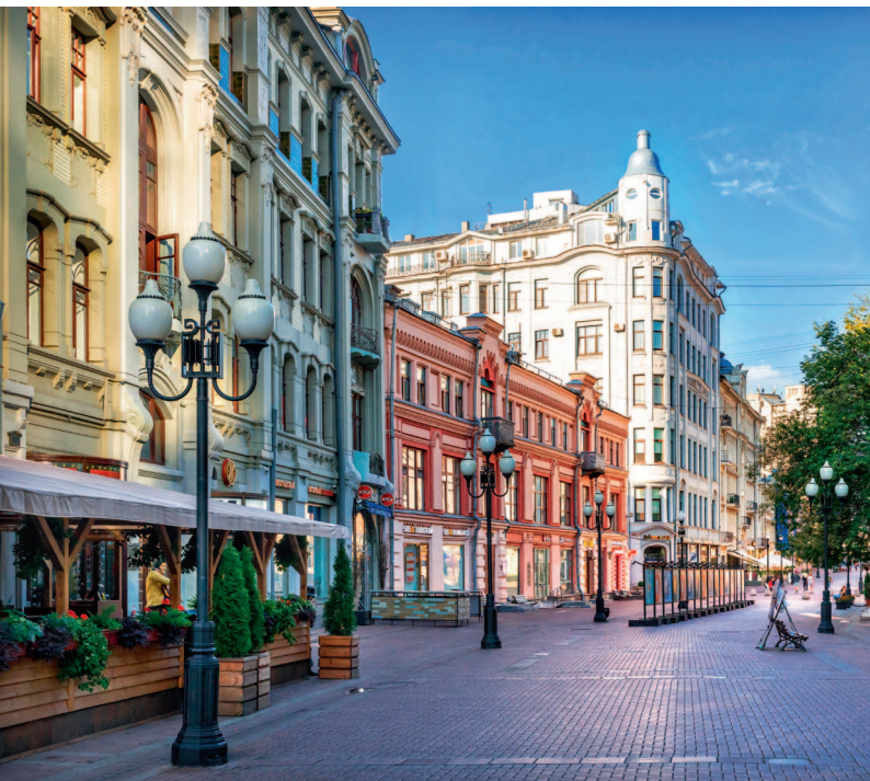
↑ Старый Арбат