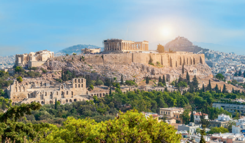
↑ Афинский Акрополь