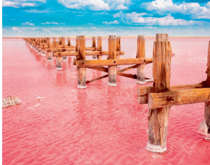
↑ Ла-Пас. Лагуна Колорада