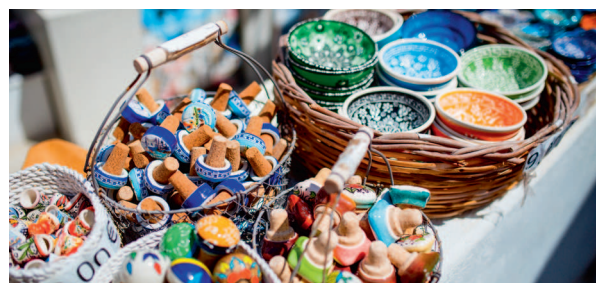
↑ Красочные керамические сувениры на рынке в Греции

Афины, названные в честь богини мудрости, — один из древнейших городов мира и при этом одна из самых юных европейских столиц. До 1000 г. до н. э. Афинами правили цари. Тогда Афины лишь закладывали основы будущей культурной столицы Греции, расцвет которой настанет в V–IV веках до н. э. Официальной столицей Греции город стал в 1834 году после национально-освободительной войны XIX века.