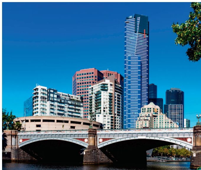
↓ Мельбурн. Башня Эврика