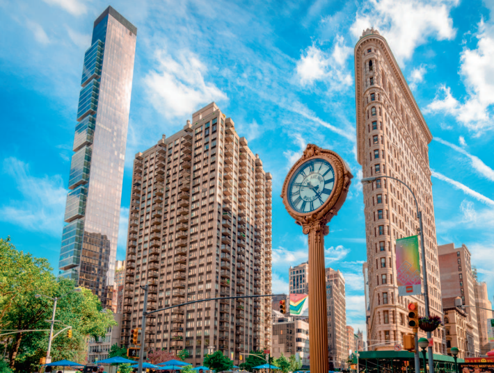
↑ Нью-Йорк. Дом-утюг