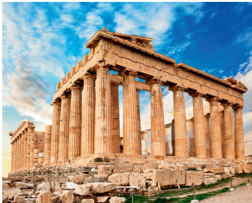
↑ Парфенон — храм на территории Афинского Акрополя, посвященный богине Афине

Парфенон — одно из самых необыкновенных зданий Афинского акрополя. Он был заложен в 447 году до н. э. и строился пятнадцать лет. К работам привлекли звезд архитектуры — Фидия, Калликрата и Иктина. На возведение Парфенона из мрамора были потрачены огромные для тех времен деньги, за что активно критиковали тогдашнего правителя Перикла. Главным украшением храма стала статуя богини Афины, вероятно, перевезенная в Константинополь в V столетии и там исчезнувшая. Парфенон переживал периоды расцвета и упадка: горел, был взорван после попадания пушечного ядра, разворован турками, местными жителями и англичанами, вывозившими из него статуи. Но даже в нынешнем виде Парфенон и его дорические колонны вызывают восторг.