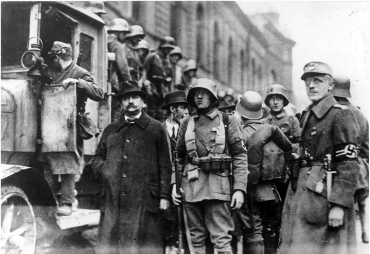
▲ Участники «пивного путча» с арестованными ими членами городского совета Мюнхена