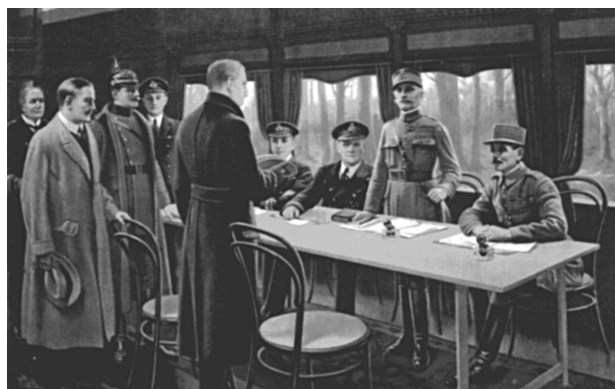
▲ «Компьенское перемирие», М. П. Верней

Договор вступил в силу 10 января 1920 года после ратификации его Германией и четырьмя главными союзными державами — Великобританией, Францией, Италией и Японией. Сенат США отказался утвердить Версальский мирный договор из-за нежелания связывать себя участием в Лиге Наций. Взамен этого США заключили с Германией в августе 1921 года особый договор, почти идентичный Версальскому, но не содержащий статей о Лиге Наций.