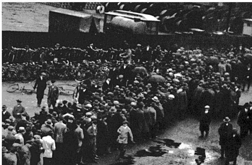
◀ Очередь безработных у биржи труда в Ганновере, 1932 год

Положение усугублялось еще недовольством населения из-за оккупации Рура французскими войсками, которые находились в районе угольного бассейна,