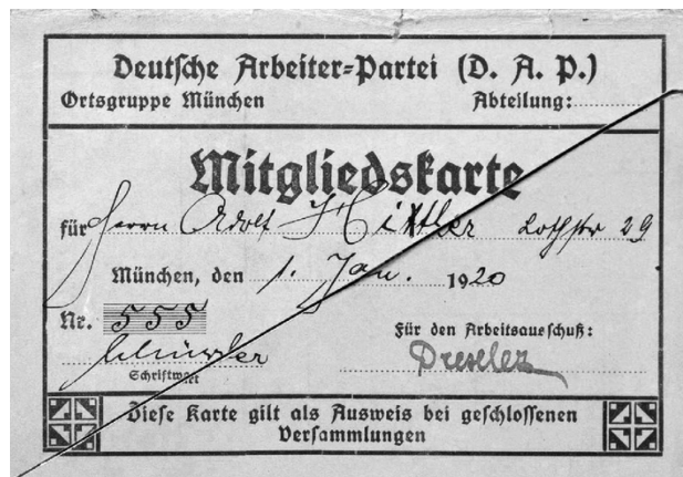
▲ Партийный билет Адольфа Гитлера

8 ноября 1923 года Гитлер поднялся на сцену в пивном подвальчике «Левенбрау» и призвал собравшихся членов партии правых сначала к организации военного переворота в Баварии, а затем и к свержению правительства левых в Берлине. Возглавив так называемый «пивной путч» (он арестовал в пивном зале «Бюргербройкеллер» диктатора Бава-