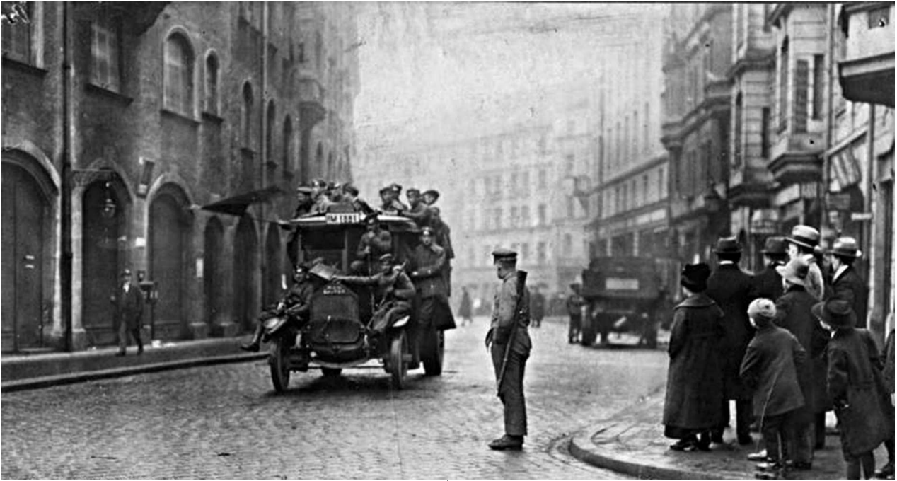
▲ Восстание в Мюнхене, 1919 год

вий мира между союзными и присоединившимися державами и Германской республикой свершилось. Карта освобожденного мира окончательно установлена. Заседание закрывается!»*