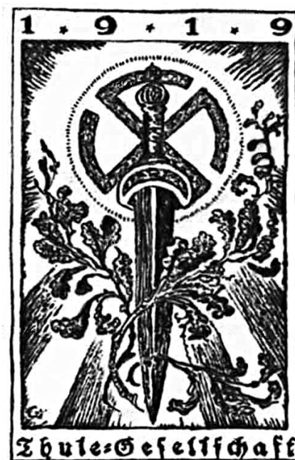
▲ Эмблема «Общества Туле»

и почвы». Они обосновывали и пропагандировали «превосходство германского духа, арийской расы» и немецкой культуры над либеральной цивилизацией остальной Европы. В это движение входили многотысячные общественные организации — молодежные, крестьянские, рабочие и иные союзы, а также группы интеллигенции, которые занимались разработкой идеологии немецкого расизма и национализма. Среди последних особое место занимали оккультные ордена: «Германский орден», «Орден рыцарей святого Грааля» и «Общество Туле», избравшие своей эмбле-