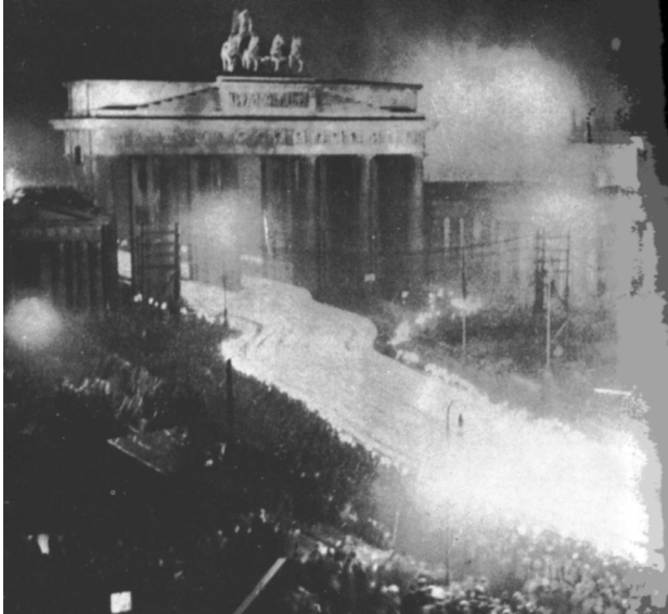
▲ 30 января 1933 года. Факельное шествие в честь назначения Гитлера рейхсканцлером

ренные консерваторы, поэтому фон Папен считал, что это удовлетворит всех. В результате 30 января 1933 года Гинденбург предложил Гитлеру занять пост канцлера. Позднее нацисты предприняли попытку переписать историю и утверждали, что Гитлер стал канцлером по воле судьбы. На самом же деле прийти к власти Гитлеру позволили экономические обстоятельства, а также поддержка одних и просчеты других политиков.