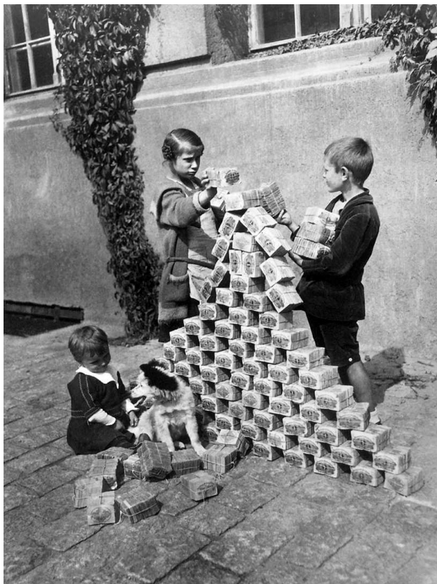
▲ Гиперинфляция в Германии. Дети играют пачками денег

Положение усугублялось еще недовольством населения из-за оккупации Рура французскими войсками, которые находились в районе угольного бассейна,