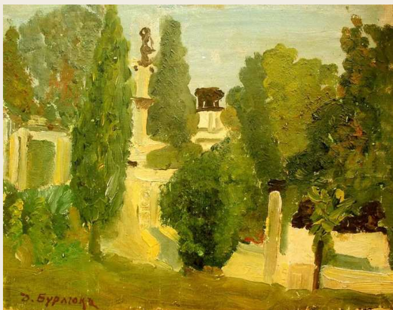
В ПАРКЕ. 1900. ЧАСТНОЕ СОБРАНИЕ

Первым следует назвать Одесское художественное училище и одного из главных преподавателей — Кириака Константиновича Костанди. Уроженец села Дофиновка Херсонской