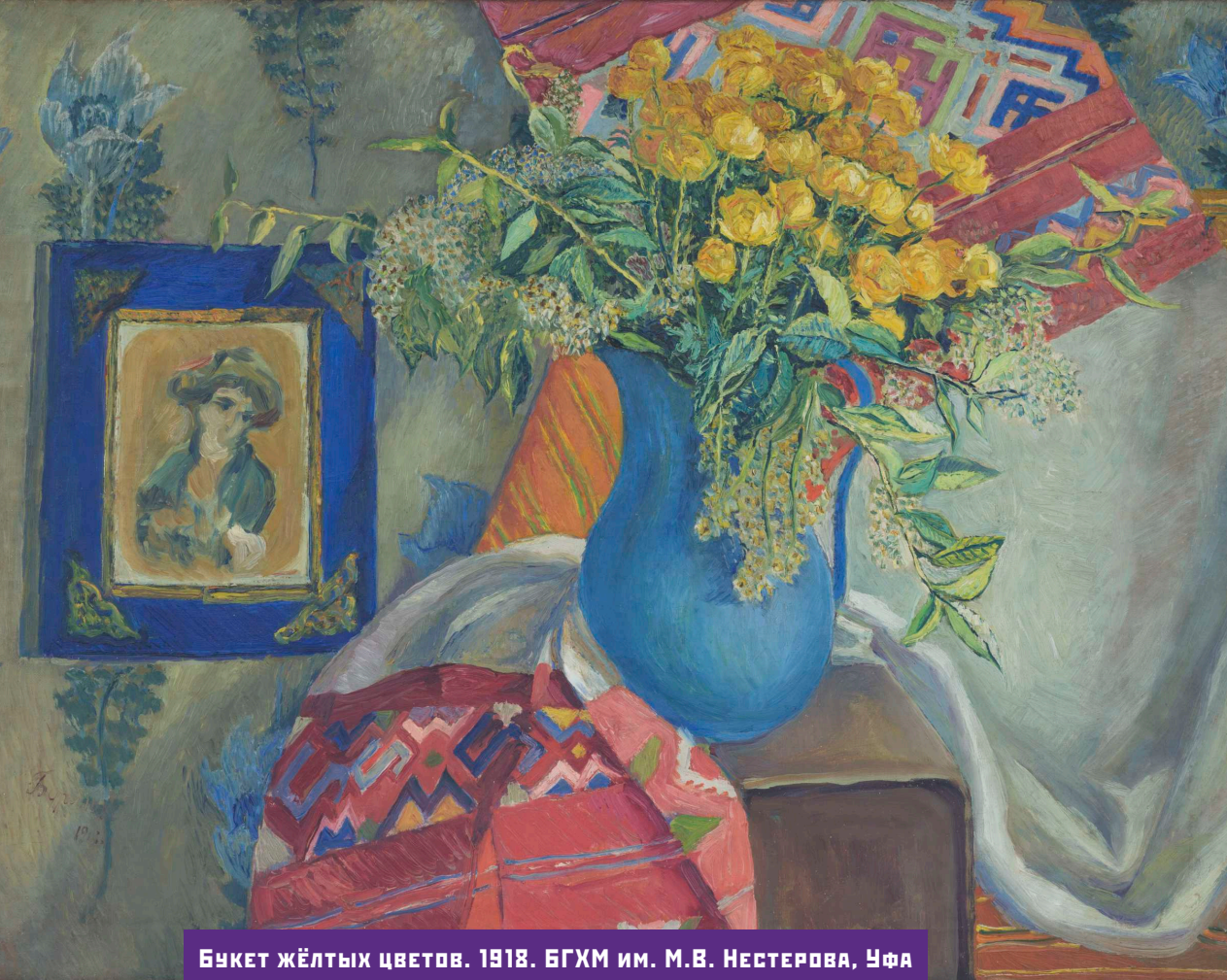
БУКЕТ ЖЁЛТЫХ ЦВЕТОВ. 1918. БГХМ им. М.В. НЕСТЕРОВА, УФА

губернии, Костанди был пленэристом и своих студентов обучал пленэру. Его пейзажно-жанровые картины 1890-х годов привлекают и очаровывают умением непосредственно передать природные краски цветущих садов и полей. В частности, для Давида Бурлюка эти картины были важным уроком и открыли перед ним одно из направлений дальнейшего развития — пленэр.