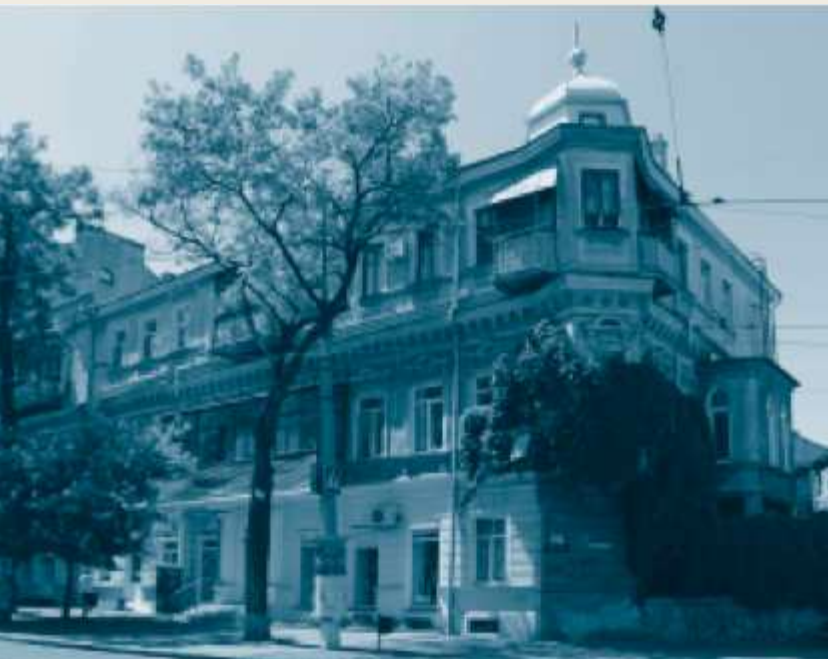
Дом в Одессе. 1911-1912

«пользовались большой свободой». Для Давида Бурлюка свобода состояла в том, что он, удовлетворяя свою тягу к «стенной живописи», покрыл все белые стены флигеля, где жил, рисунками углем «всевозможных физиономий и рож типа гротеск».