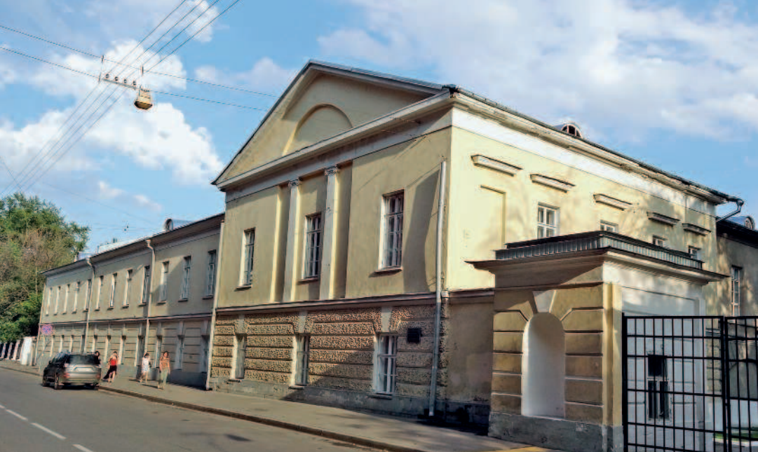
Флигель дворца на ул. Казакова

В начале XIX века эта усадьба была самым примечательным объектом всего района за Земляным Валом. Граф Алексей Кириллович Разумовский летом часто устраивал балы, и Гороховая на время превращалась в центр светской жизни Москвы.