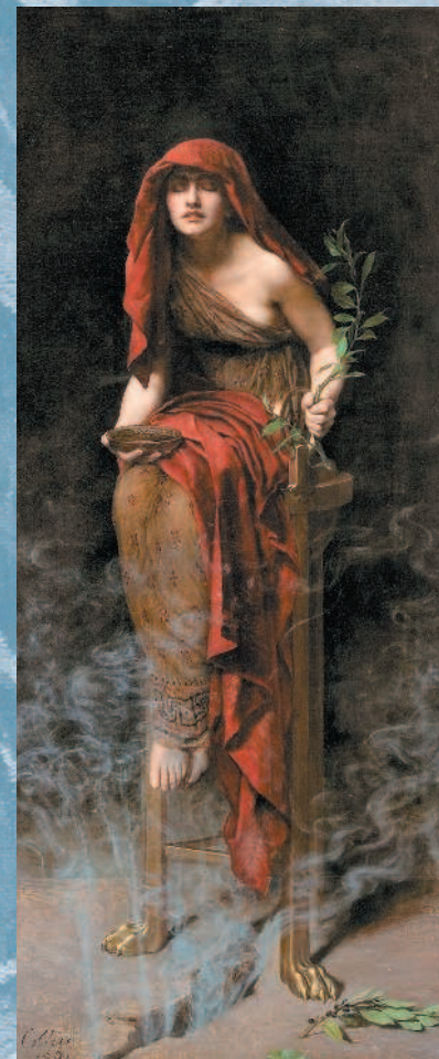
Джон Кольер. Дельфийская жрица. 1891 г.

Все было уже готово для жертвоприношения. Пасть под ножом жреца должен был юный Фрикс, но вдруг явился златорунный овен, дар бога Гермеса. Послала овна мать Фрикса, богиня Нефела, чтобы спасти своих детей. Сели на златорунного овна Фрикс с сестрой своей Геллой, и овен понес их по воздуху далеко на север.