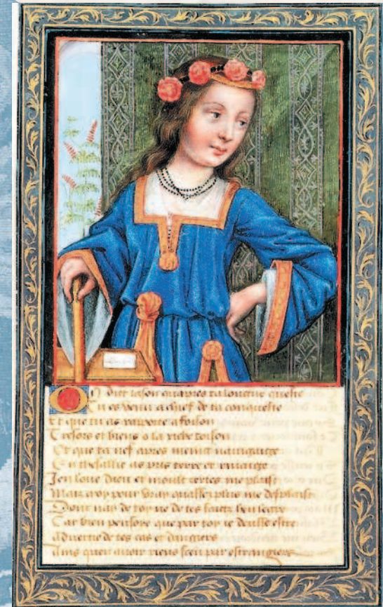
Царица Гипсипила. Миниатюра французской школы. XV в. Хантингтонская библиотека. Сан-Марино.

В честь прибытия героев царица Гипсипила учредила состязания по многоборью (пентатлону), которые включали в себя бег, метание диска и копья, прыжок и борьбу. Таким образом, остров Лемнос стал прародиной современного пятиборья.