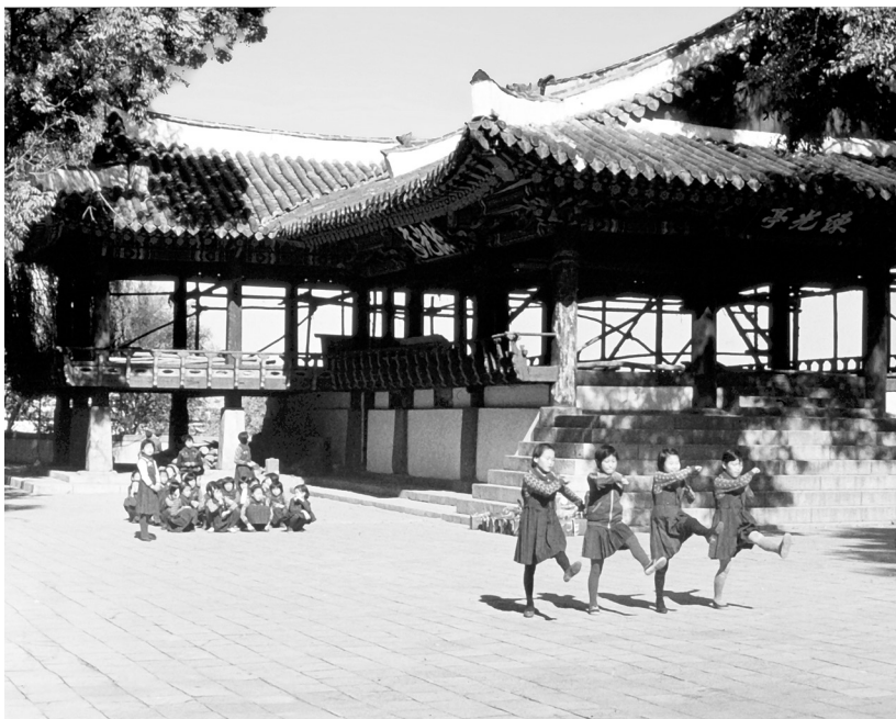
Строевая подготовка девочек на берегу Тэдонгана