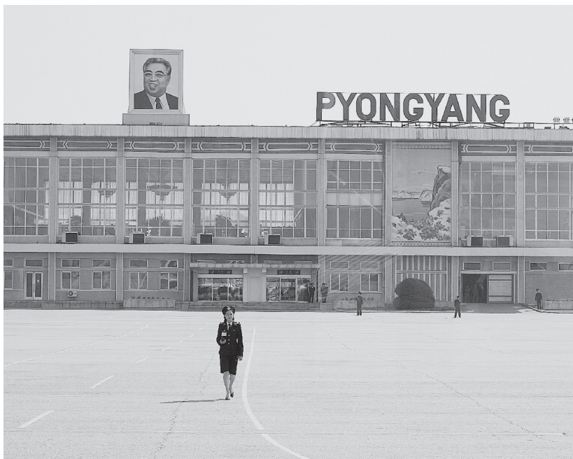
Аэропорт Сунан, старый терминал

Все вокруг было покрыто зеленью, вдоль дороги шли женщины в брюках, даже не ведая, что иностранцы почему-то думают, что в КНДР это запрещено.