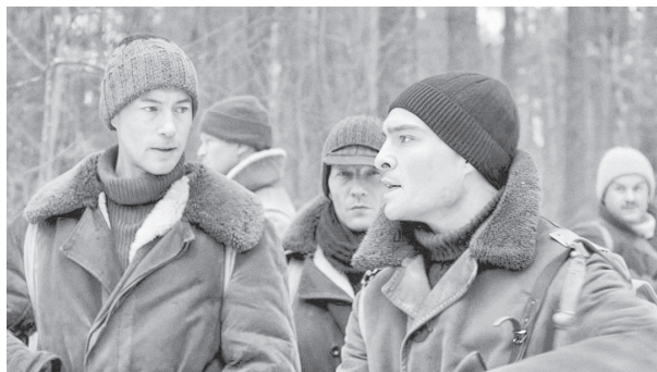
Шапочки внукам их миссии «Алсос» вязала бабуля. Кадр из фильма

После открытия второго фронта в 1944 г. Миссия Алсос оказалась во Франции. Но группа лишь следовала за передовыми войсками, обыскивая отвоёванные территории. Ни о каких спецоперациях в тылу речи даже близко не было. Ни в Париже, ни в Брюсселе миссия не смогла найти ни нужных людей, ни документов. Только после освобождения Страсбурга 15 ноября 1944 г. удалось захватить нескольких немецких учёных-физиков 4 и некоторые важные бумаги.