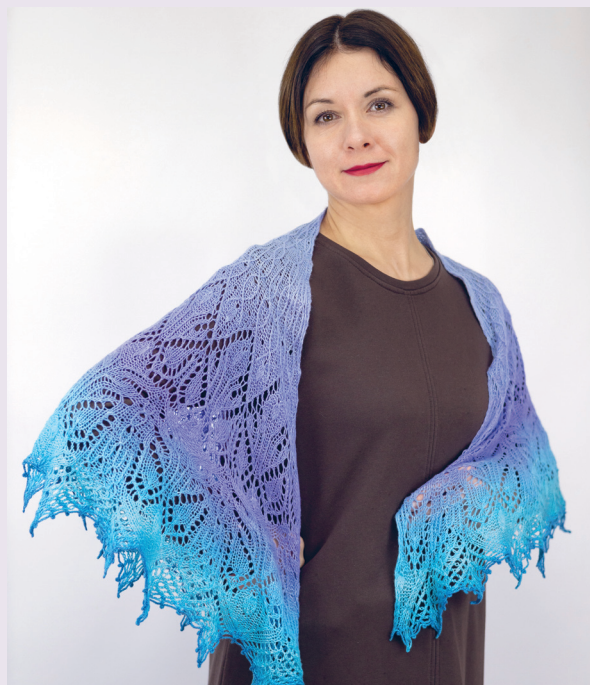
Сады Семирамиды 75