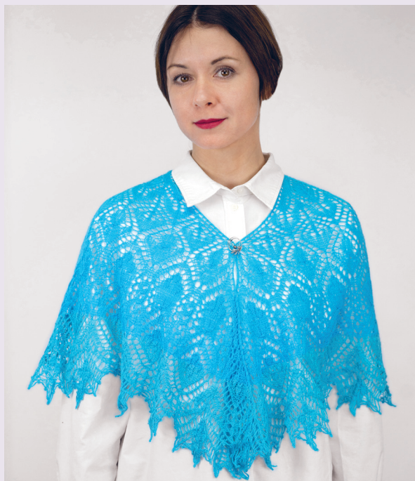
Летняя кадиль 63