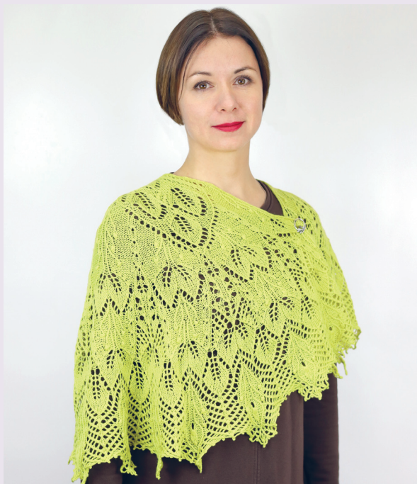
Восточная Принцесса 89