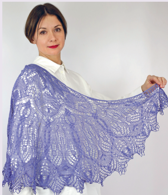
Шамаханская царица 103