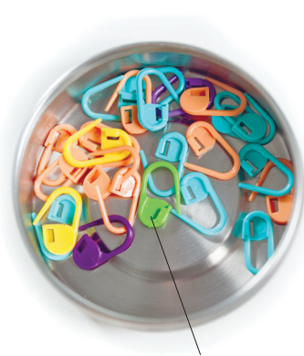
маркеры для вязания

раппорта или первый ряд узора, место прибавления и убавления петель. Они бывают разной конструкции: в виде колец и подвесок, разъемные и неразъемные. Я часто применяю самые простые разъемные маркеры, чтобы отметить начало и конец раппортов или выделить центральный мотив шали. Вместо них можно взять отрезок нити контрастного цвета, английскую булавку или канцелярскую скрепку.