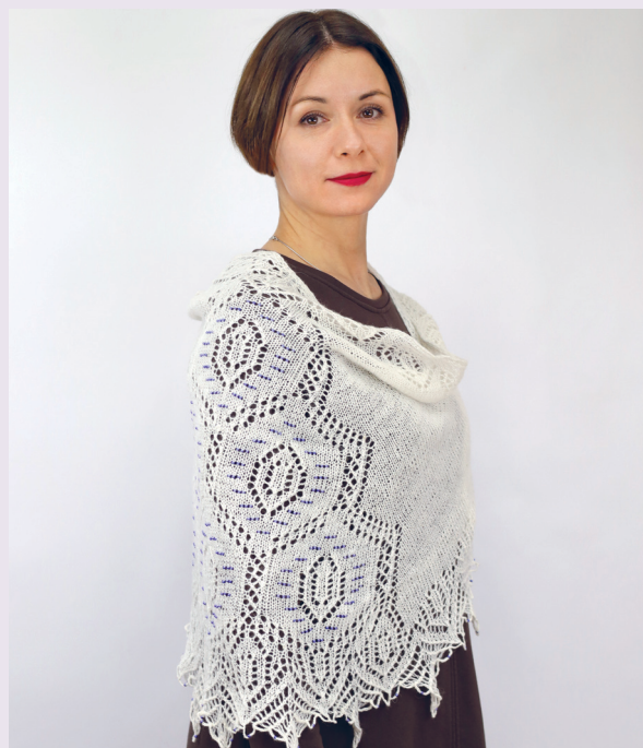
Горный хрусталь 133