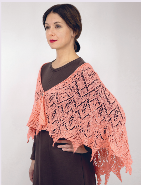
Прелестная Колумбина 147