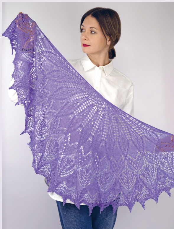
Ночная фиалка 163