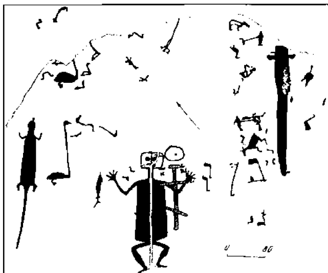
Наскальный рисунок у мыса Бесов Нос на Онежском озере