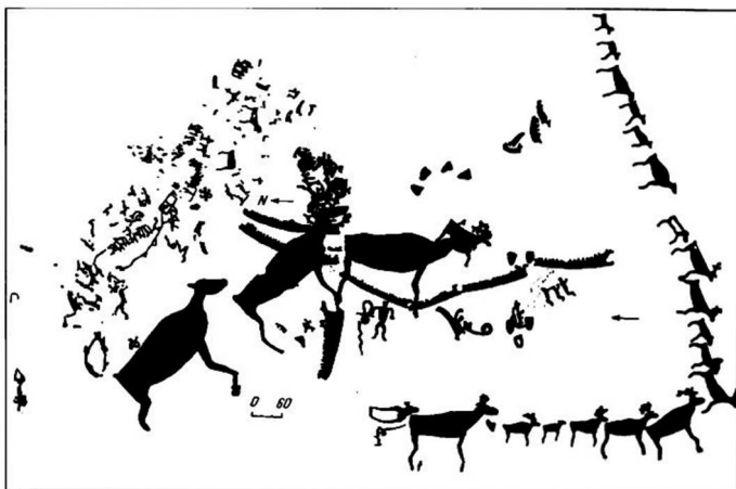
Наскальный рисунок в урочище Залавруга близ г. Беломорска

Знакомый нам сюжет можно обнаружить на острове Гурий на Онежском озере: огромная водоплавающая птица сносит яйцо, под которым изображены солярный