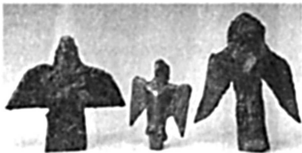
Бронзовые фигурки птиц

нуется — Линнунрата у финнов, Линнутее у эстонцев, Нармонь ки у мордвы-мокши. У других финно-угорских народов это наименование конкретизируется: Кайык-комбо корно у марийцев, Дзо-дзог туй у коми-зырян, Вирь мацеень ки у мордвы эрзи, Луд зазег сюрес у удмуртов означает «Гусиный путь».