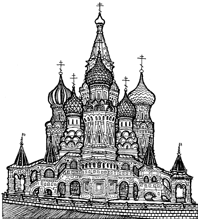
Покровский собор (храм Василия Блаженного)

Расхождение мнений выявил вопрос о направленности дальнейших действий во внешней политике. Иван Грозный хотел вести войну за выход России к Балтийскому морю, а члены его «рады» хотели дальнейшее продвижение на юго-восток.