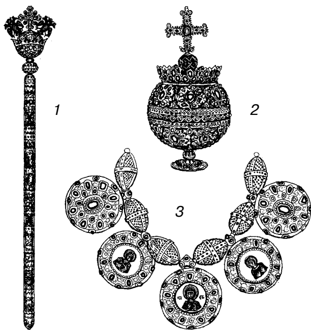
Скипетр (1) и держава (2) царя Алексея Михайловича и княжеские бармы (3)

16 января 1547 года великий князь Московский Иван IV Грозный венчался в Успенском соборе Московского Кремля на царство шапкой Мономаха, с возложением на него барм, креста, цепи и вручением скипетра. (При венчании на царство царя Бориса Годунова прибавилось вручение и державы как символа власти.)