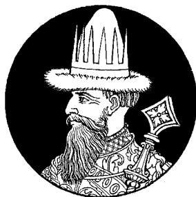
Иван IV Грозный

Иван быстро развивался физически, в 13 лет он был уже настоящим верзилкой. Окружающих поражали буйство и неистовый нрав Ивана. В 12 лет он забирался на островерхие терема и спихивал оттуда кошек и собак — «тварь бессловесную».