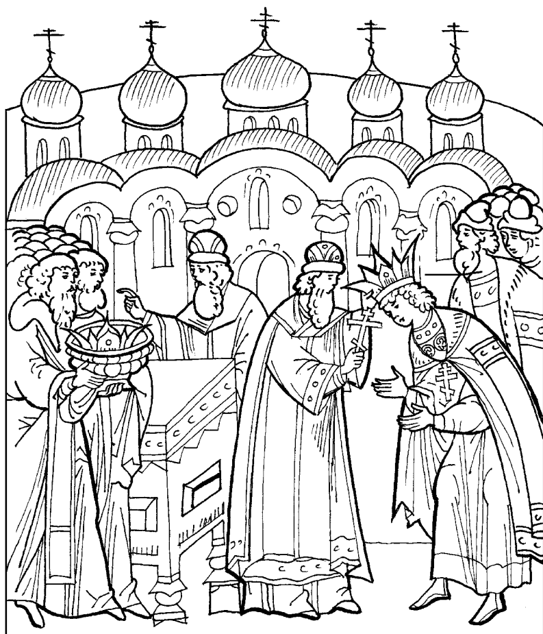
Венчание на царство Ивана Грозного в 1547 г.

Венчание на царство — торжественный обряд, заимствованный Россией из Византии, во время которого будущих императоров облачали в царскую одежду и возлагали на них венец (диадему). В России «первовенчанник» — внук Ивана III Дмитрий, он венчался на «великое княжение Владимирское и Московское, и Новгородское» 4 февраля 1498 года.