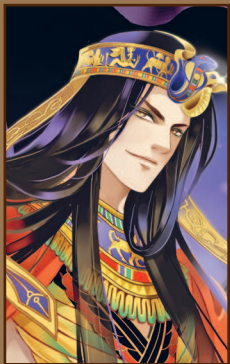
БИФЕТУ (РАМСЕС II)

Великий фараон Древнего Египта из XIX династии и сын Сети I. Умён, отважен и искусен в бою. Влюбился в Айви (Нефертари) с первого взгляда.