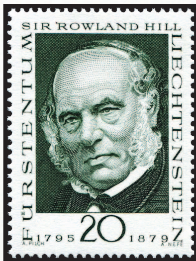
Лихтенштейн, 1968 г. Сэр Роуленд Хилл