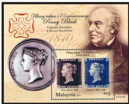
Малайзия, 2015 г. Блок собрал воедино репродукции первых марок, портрет Хилла, оттиск штемпеля, которым чаще всего гасили «Черный пенни», и изображение медальона работы Уильяма Вайона, по которому Фредерик Хит гравировал портрет

Я не стал бы так подробно рассказывать о первой марке мира, точнее, о первых марках в 1 пенни и 2 пенса, если бы не одна тонкость. Эти миниатюры изготовлены с особой тщательностью. Достаточно сказать, что королева