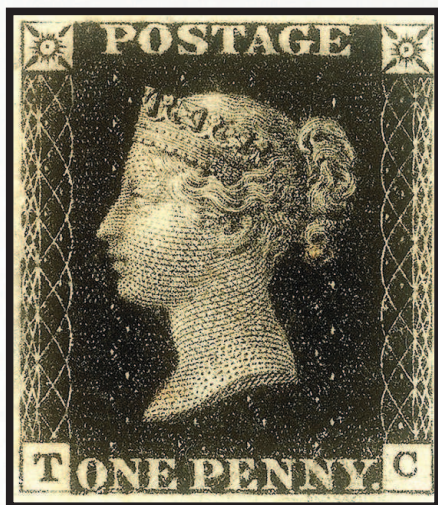
Англия, 1840 г. «Черный пенни»

будто бы стал свидетелем сцены, когда почтальон принес девушке письмо, но та отказалась заплатить за него, сославшись на бедность. И письмо должно было вернуться к отправителю. Любезный джентльмен предложил оплатить доставку, но юная леди категорически отказалась. Когда же почтальон удалился, она призналась Хиллу, что на листе бумаги, сложенном несколько раз и заклеенном, нет ничего, кроме адресов. Просто они с женихом, учитывая дороговизну почтовых услуг, придумали хитрость. Молодой человек посылает ей пустой конверт, и девушка, видя это послание в руках почтальона, узнаёт, что с возлюбленным всё в порядке. А потом неоплаченный конверт возвращается, что служит ответным знаком внимания... Так Роулэнд Хилл понял: письма должен оплачивать не получатель, а отправитель. Подтверждением же того, что за письмо не надо платить получателю, должна служить наклеенная на конверт заранее купленная марка. По другой легенде, адресатом послания являлась мать солдата, который служил в Индии.