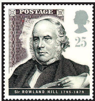
Великобритания, 1995 г. Сэр Роулэнд Хилл