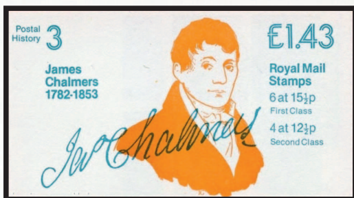
Великобритания, 1982 г. Джеймс Чалмерс на обложке марочного буклета

Однако спустя два года почтовики одумались, и 7 августа 1839 года эти предложения получили силу закона. На конкурс проектов марок и конвертов поступило 2700 предложений. В итоге Хилл одержал победу.