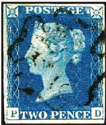
Англия, 1840 г. Гашеный «Синий двухпенсовик»