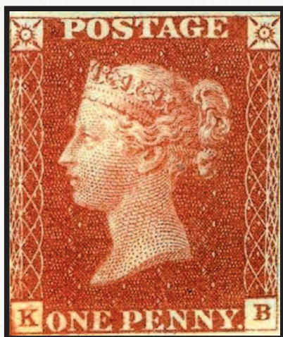
Англия, 1841 г. «Красный пенни»

разносторонне образованным, интересовался типографским делом и внес предложения, которые помогли сконструировать ротационную печатную машину. В 1854 году он возглавил почтовое ведомство Англии и, получив за свое изобретение королевскую милость, стал именоваться сэром... Портрет сэра Роуланда Хилла помещен на марках разных стран мира.