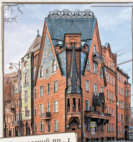
Соймоновский пр., 1

Мы с вами все еще на Патриаршем мосту и осмотрели не все здания во круг. Напротив «Красного Октября» на углу стоит самый необычный московский дом (Соймоновский пр., 1). Он похож не на городское здание, а на декорацию к опере «Снегурочка». Дом сложен из нарочито «народных» деталей и покрыт керамическими панно со сказочными животными.