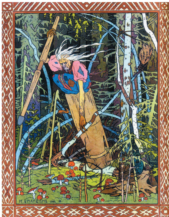
И. Билибин. Баба-Яга. Иллюстрация к сказке «Василиса Прекрасная»

БАБА-ЯГÁ или ягá-баба — сказочное страшилище, большуха [главная] над ведьмами, подручница сатаны; Баба-яга костяная нога: в ступе едет, пестом погоняет (упирается), помелом следы заметаает ; она простоволоса и в одной рубахе, без опояски: то и другое верх бесчиния.