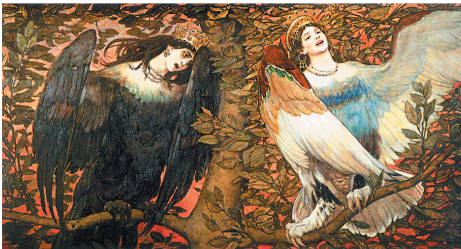
В. Васнецов. Сирин и Алконост

АЛКОНО́СТ м. — сказочная райская птица с человеческим лицом, изображавшаяся на наших картинах.