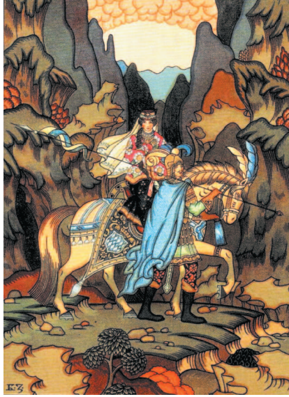
Б. Зворыкин. Иллюстрация к «Сказке о мертвой царевне и о семи богатырях» А.С. Пушкина

АМАЗО́НКА ж. — наездница; □ долгое, широкое женское платье, обычно суконное, для верховой езды.