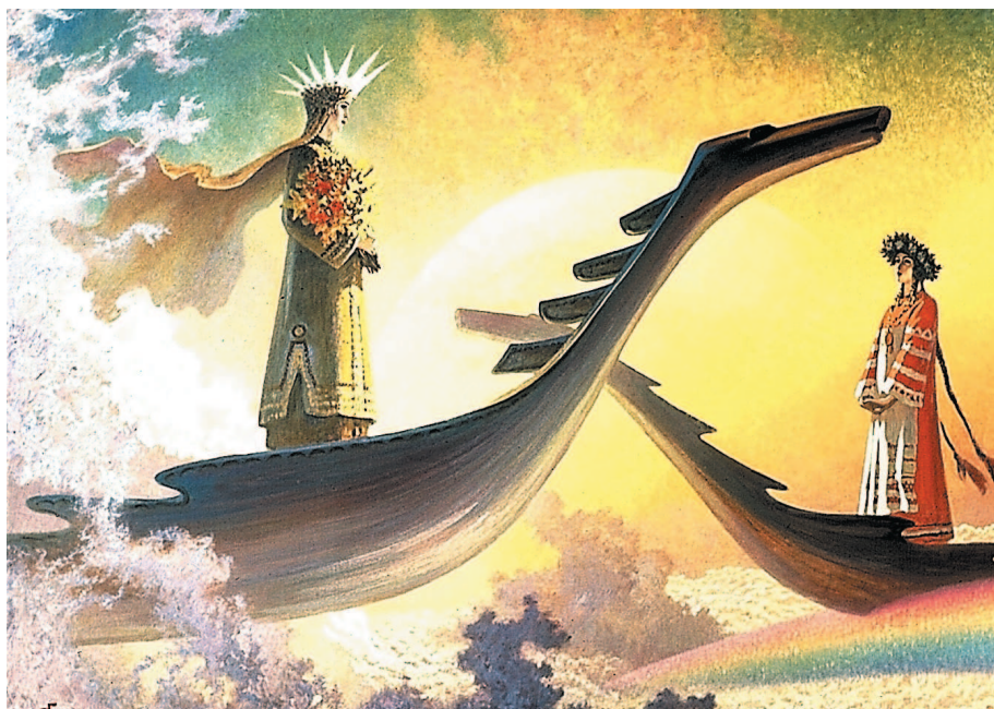
Аврора на картине художника Б. Ольшанского «У небесного причала»

А́ЗБУКА ж. — алфавит; собрание в порядке всех письмен, букв.