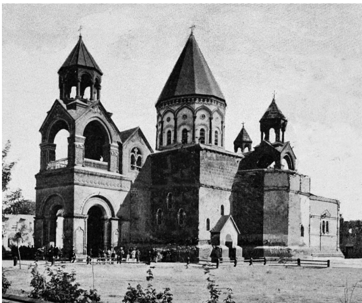
Эчмиадзинский собор — самый древний в Армении (фотография сделана Генри Линчем, британским путешественником, 1901 г.)

К сожалению, исконные сказания многих кавказских народов сохранились плохо. Это и понятно, ведь Армения и Грузия стали одними из первых стран, которые приняли христианство, да и ислам проник в регион довольно рано.