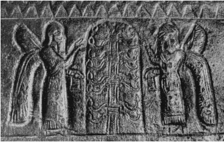
Древо жизни. Урарту. Изображение на шлеме. Дата создания неизвестна

Позже у нахских народов все подземные миры объединились в один — Ел. Находится он на западе, а солнце здесь светит только ночью. Жители подземного мира ведут обычную жизнь, но работают в темное время суток.