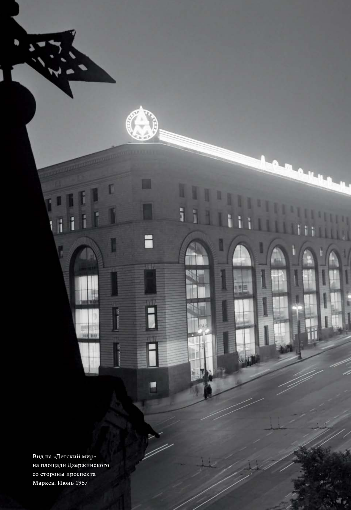
Вид на «Детский мир» на площади Дзержинского со стороны проспекта Маркса. Июнь 1957