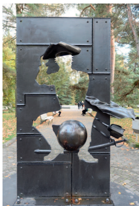
Памятник барону Мюнхгаузену в центральном парке Калининграда. Открыт по инициативе общественной организации «Внучата Мюнхгаузена». Автор скульптуры Георг Петая.