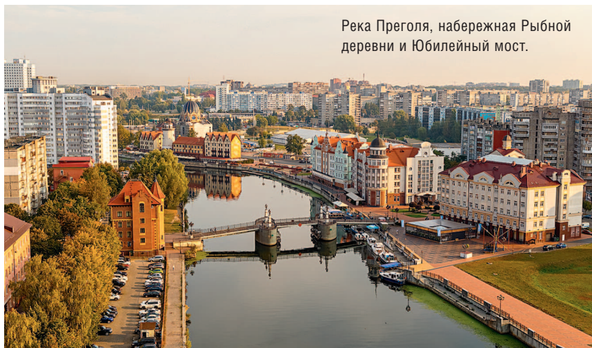
Река Преголя, набережная Рыбной деревни и Юбилейный мост.

библиотека», двадцать томов истории, теологии, дипломатии в тяжелых серебряных окладах с золочением. Более того, именно здесь частично располагалась легендарная Янтарная комната, вокруг которой до сих пор ходит много легенд и тайн. Здесь неоднократно проходили коронации герцогов, а в 1861-м замок стал местом коронавания первого императора Германии Вильгельма I. После окончания Первой мировой войны в Королевском замке Кёнигсберг разместился музей «Пруссия». Основные разрушения замка произошли в ходе боевых действий 1944–1945 годов после английских авианалетов. Затем из развалин замка брали кирпич, и в 1952-м обвалилась главная башня, после чего руины в целях безопасности решено было окончательно взорвать. В результате сейчас остались несколько рунированных фрагментов стен, которые законсервированы до лучших времен. Символично, что на месте замка в 1970-е начали возводить «Дом Советов», но этот объект, ввиду разных причин, так и не был