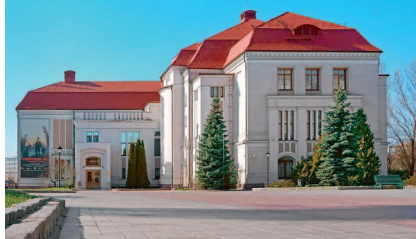
Калининградский областной историко-художественный музей.

зал рассказывает о ранних временах заселения края и жизни балтских племен. Зал истории освещает период от завоевания Пруссии тевтонцами. Здесь можно увидеть образцы орудий, мебели, предметов быта горожан. Есть отдельный Зал войны, он посвящен жизни города в годы Второй мировой войны и Восточно-прусской военной операции 1944–1945 годов. Проникнуться этими историческими событиями поможет трехмерная панорама «Кёнигсберг-45. Последний штурм», а также документы,