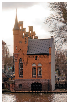
Еще одно место, связанное с именем барона Мюнхгаузена, — дом смотрителя Высокого моста, его также называют «Домик барона Мюнхгаузена». Сейчас в нем находится Музей открыток (Багратиона ул., 4).

украшенные башнями и просторными балконными террасами. Для сохранения комфортной среды в поселке были введены правила, например, должна была строго держаться дистанция между домами в 30–35 метров, а сами строения не могли иметь более двух этажей, за исключением мансард. Для любителей зодчества очень отрадно, что прусский вариант города-сада практически без потерь пережил войну, хотя многие виллы были перестроены. Здесь во время неторопливой прогулки можно встретить и рассмотреть сооружения, выстроенные в разных стилях направлениях — от неоклассики до конструктивизма. Но господствует здесь югендстиль, немецкий вариант модерна, с его асимметрией, фигурными окнами, башнями и эркерами, лепниной и витражами. Самыми