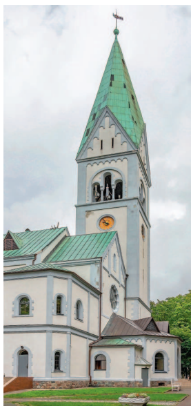
Кирха памяти королевы Луизы.