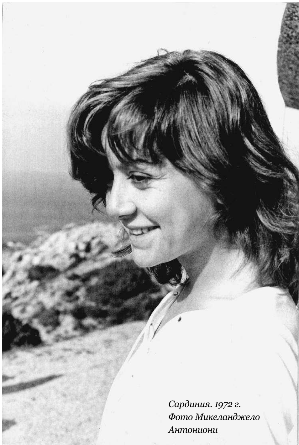
Сардиния. 1972 г. Фото Микеланджело Антониони