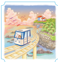
Ульджин. Побережье Джукбён 38