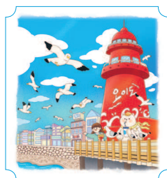
Сихын. Остров Оидо 42