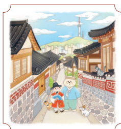
Сеул. Деревня Букчон Ханок 52