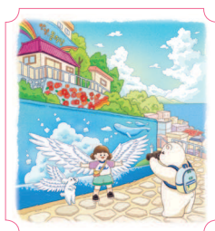
Тхонъён. Деревня настенной живописи 06