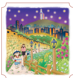
Сеул. Парк Наксан 54