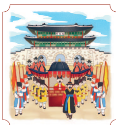
Сеул. Кванхвамун 56