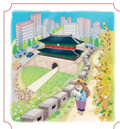
Сеул. Ворота Суннемун 60