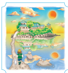
Сосан. Ганворам 44