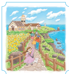
Чеджу. Сопчикоджи 40