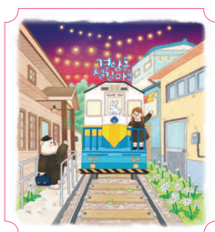
Кунсан. Деревня Кёнам-дон 08