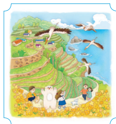
Намхэ. Деревня Дарэнги 32