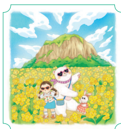
Чеджу. Гора Санбансан 16