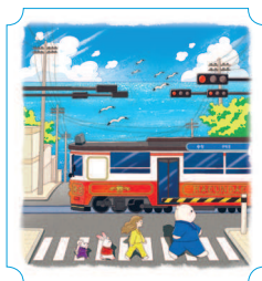
Пусан. Железная дорога 34