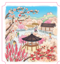
Кванъян. Сливовая деревня 04