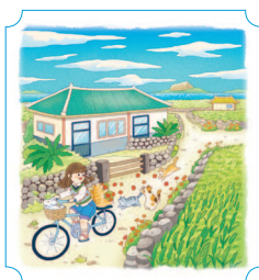
Чеджу. Капхадо 46