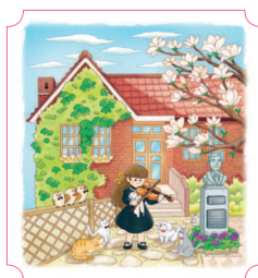
Сеул. Дом Хоннанпха 12