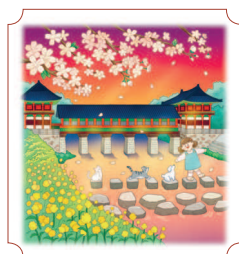
Кёнджу. Мост Вольчжонгё 50