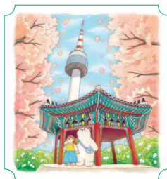
Сеул. Башня Намсан 26