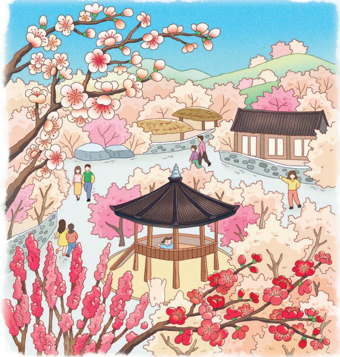
Кванъян. Сливовая деревня 광양 매화마을

Деревня, утопающая в белых сливовых цветах, танцующих, словно волны в море.