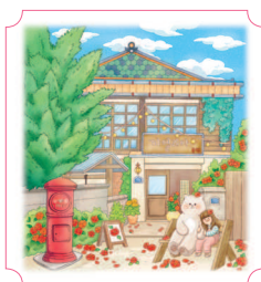
Пхохан. Камелия 10