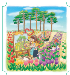
Пхэнтхэк. Центр агроэкологии 24