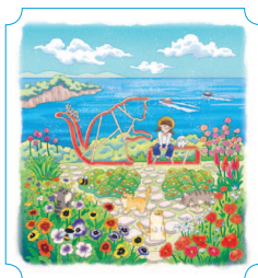
Кохын. Остров Ссуксом 36