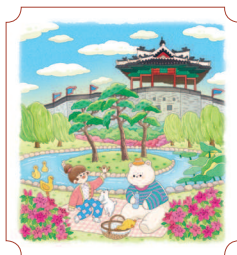
Сувон. Крепость Хвасон 62