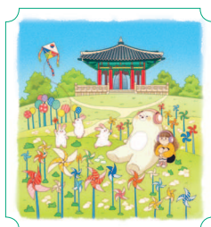
Паджу. Парк мира Имчжинган 22