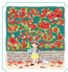
Чеджу. Камелия-Хилл 14