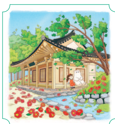
Канджин. Дасанчходан 20