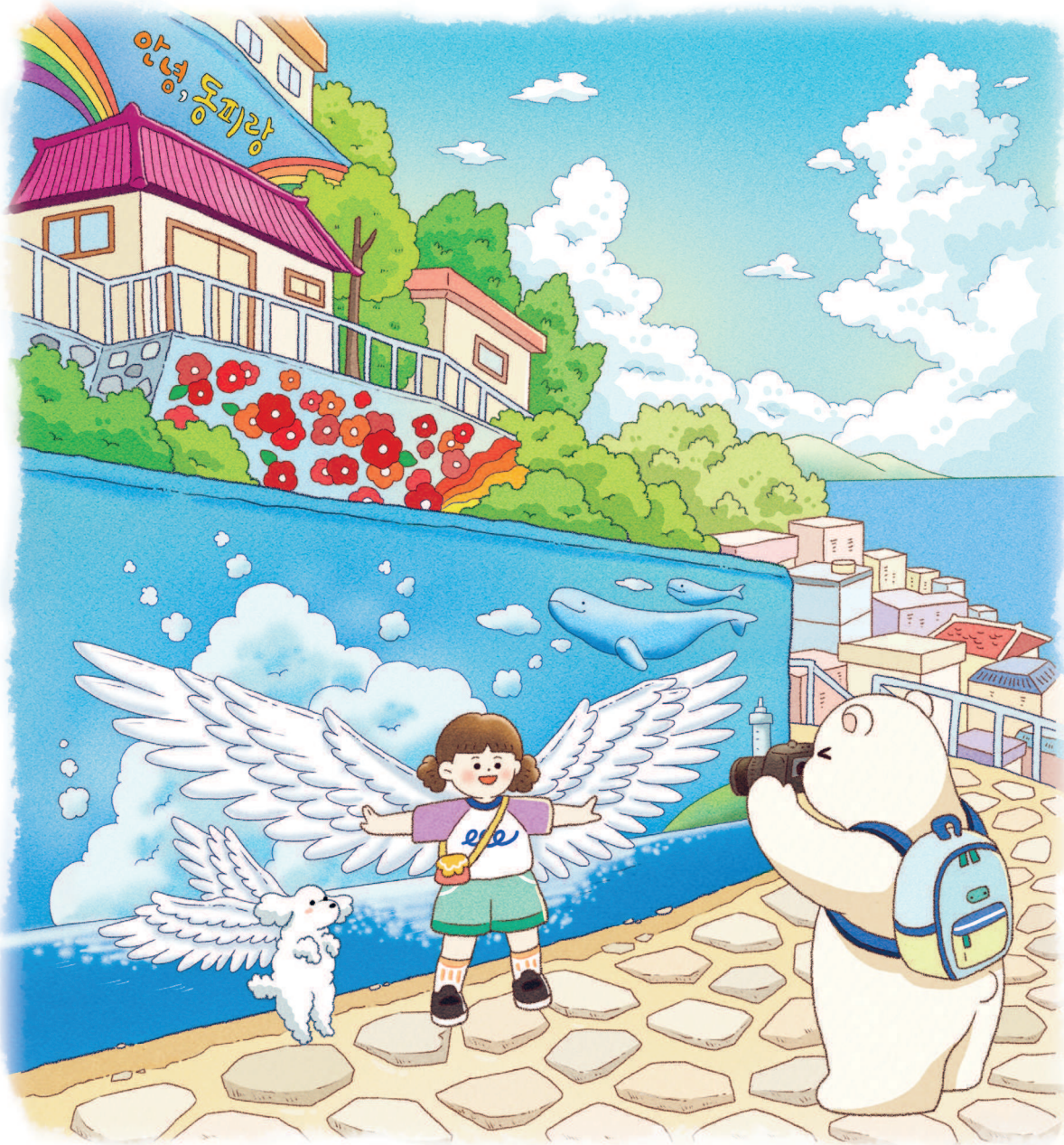
Тхоньён. Деревня настенной живописи Тонпхиран 통영 동피랑 벽화마을