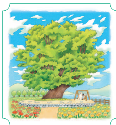
Хвачхон. Дерево любви 28