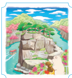
Чхорвон. Косокчжон 48