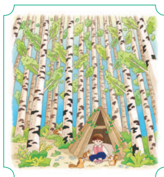
Инчже. Берёзовый лес 30