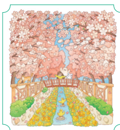
Чинхэ. Фестиваль Кунханчже 18