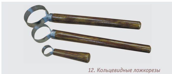
12. Кольцевидные ложкорезы

Ложкорезы в форме крючка с двусторонней заточкой. Тоже действуют в обе стороны. Такими ложкорезами работали профессиональные ложкари Нижегородской губернии. На фото 13 аутентичные ложкорезы из города Семенова — ложкарной столицы России.