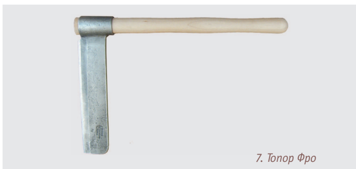
7. Топор Фро

Топор Фро. Г-образный топор для колки щепы или гонта, для раскалывания поленьев вдоль волокон на ровные бруски называют «Фро» (см. фото 7). Чтобы работать с ним, потребуются разные колотушки, которыми бьют по обуху топора. Ложжари ласково прозвали его Фросей.