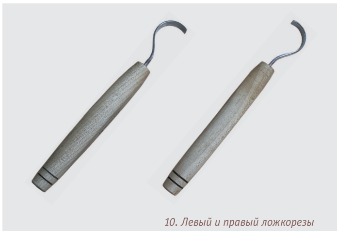
10. Левый и правый ложкорезы

Ложкорезы в форме крючка. Это самый распространенный вид. Фактически это «загнутый» нож. Радиус крючка, форма и размеры ложкореза могут отличаться. Такие ложкорезы бывают двух видов: правые и левые (см. фото 10). Как понять, какой из них правый, а какой — левый? Для этого смотрим на ложкорез со стороны обушка, острием от себя. Если изгиб крючка справа, то это правый ложкорез. Если слева, то, соответственно, — левый.