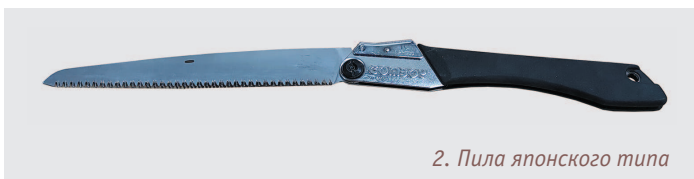
2. Пила японского типа

Для походных условий лучше приобретать складные садовые пилы или пилы для туризма. Некоторые из них продаются в чехле или кобуре, что очень удобно для транспортировки и ношения.