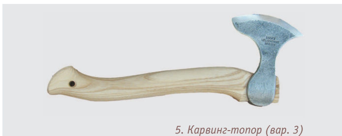
5. Карвинг-топор (вар. 3)

Топор-колун. Топориком для баклуш большой пень не расколешь. Для работы с пнями потребуется колун (см. фото 6) — увесистый топор клиновидного типа. Ему ни к чему острая заточка — колун используют только для раскалывания пней и чурок.