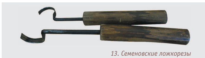
13. Семеновские ложкорезы

Ложкорезы в форме крючка с двусторонней заточкой. Тоже действуют в обе стороны. Такими ложкорезами работали профессиональные ложкари Нижегородской губернии. На фото 13 аутентичные ложкорезы из города Семенова — ложкарной столицы России.