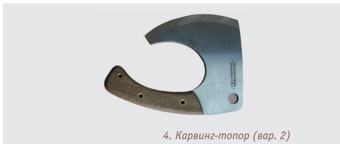
4. Карвинг-топор (вар. 2)