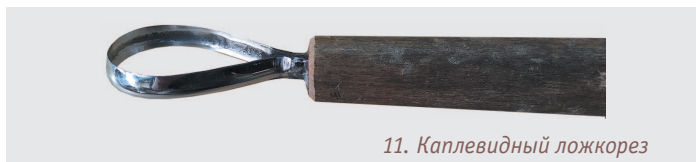
11. Каплевидный ложкорез

Каплевидные или кольцевидные ложкорезы. Эти инструменты объединили в себе функции левого и правого ложкореза (см. фото 11, 12). Ими можно работать как на себя, так и от себя.