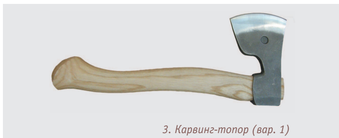
3. Карвинг-топор (вар. 1)

Карвинг-топор. Сегодня ложкари всех стран переходят на резчицкие топоры (см. фото 3–5), так называемые карвинг-топоры (от английского carving — резьба). Они действительно очень удобны для многих операций. Хотя скажу, что любой топорик весом до килограмма тоже справится с битьем баклуш. Все дело в привычке и предпочтениях.