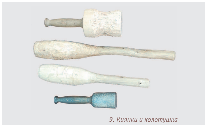
9. Киянки и колотушка

В роли колотушки может выступать любое поленце, кусок толстой ветки или киянка (см. фото 9). Некоторые мастера делают у толстой ветки ручку. Что, согласитесь, удобнее в работе и по-своему эстетичнее.