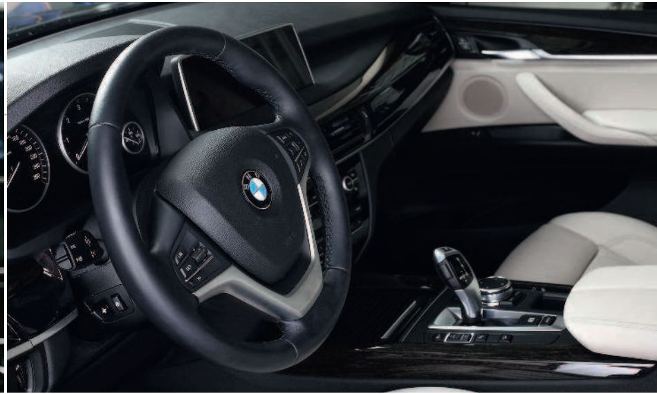
▲ BMW X5