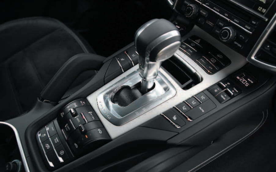
▲ Porsche Cayenne