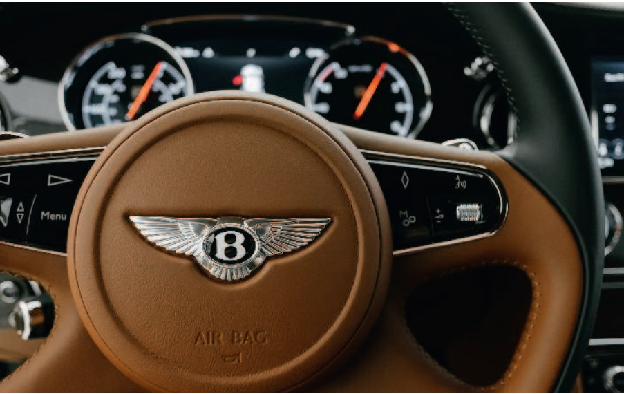
▲ Bentley Mulsanne