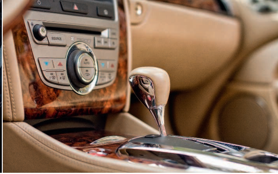
▲ Infiniti Q50