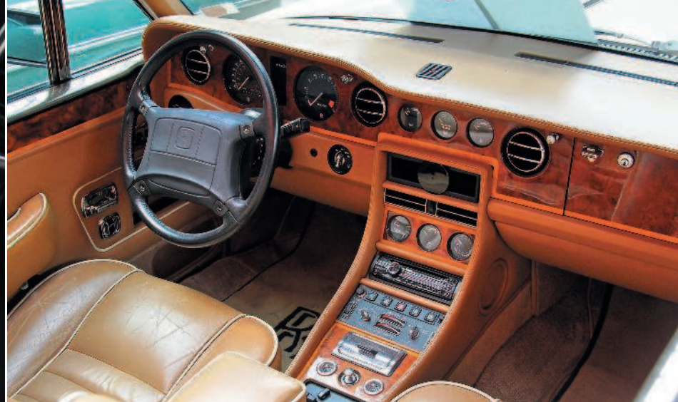
▲ Rolls-Royce Corniche