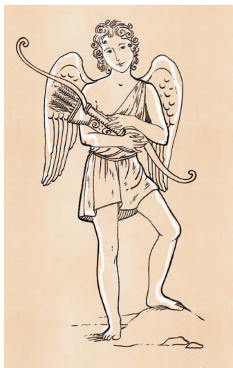
Бог любви Эрот

божество любви, олицетворение влечения, Эрот 4 , было создано из безбрежного хаоса вместе с мраком Эребом и бездной Тартаром. Именно его влияние и присутствие способствовали тому, что род богов множился: Уран и Гея рождали гигантов и титанов, затем Кронос и Рея рождали олимпийских богов. Эрот воплощал собой первозданное притяжение и силу, благодаря которой появлялась новая