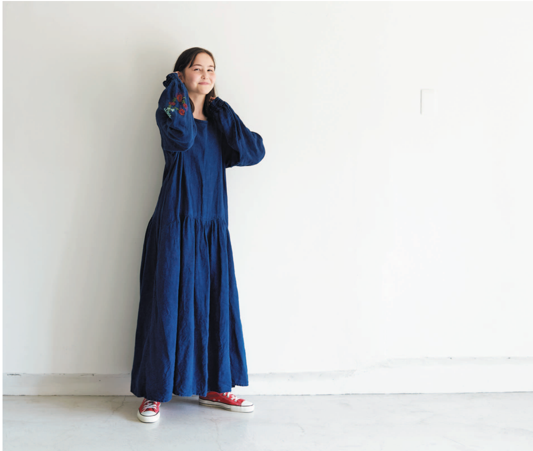
Схема – с. 73

Простой с виду штопальный стежок отлично сочетается с цветом Индиго. Украсим платье со свободными рукавами вышивкой из цветочных мотивов.