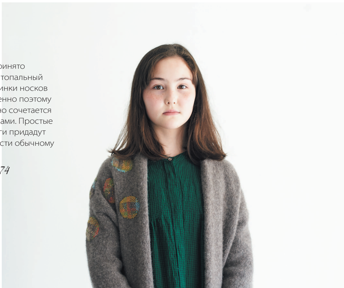
Схема – с. 74

Раньше было принято использовать штопальный стежок для починки носков и свитеров. Именно поэтому штопка идеально сочетается с вязаными вещами. Простые штопанные круги придадут индивидуальности обычному кардигану.