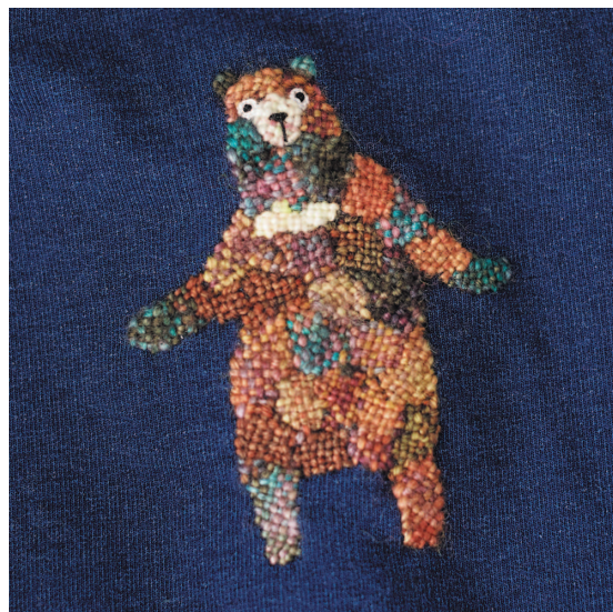
Схема – с. 74

Давайте украсим детскую одежду милой вышивкой с медвежонком. Подобно сэмамори (традиционная японская вышивка на спинке одеяния для новорожденного), вышивка будет оберегать вашего малыша от несчастья. Такую же вышивку можно сделать на школьном мешочке для сменки.