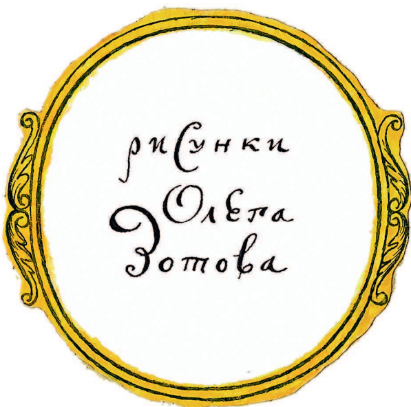
рисунок Олега Зотова