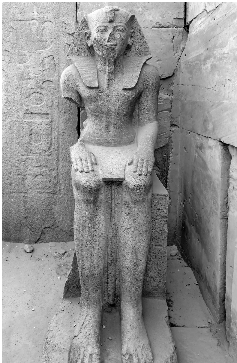
Сидячая статуя Тутмоса III. Храмовый комплекс в Карнаке. Луксор, Египет