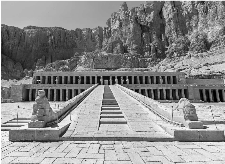
Заупокойный храм Хатшепсут. Ок. XV в. до н. э. Дейр-эль-Бахри, Египет

пяти лет. Так что естественно, что Хатшепсут стала при нем кем-то вроде регента.