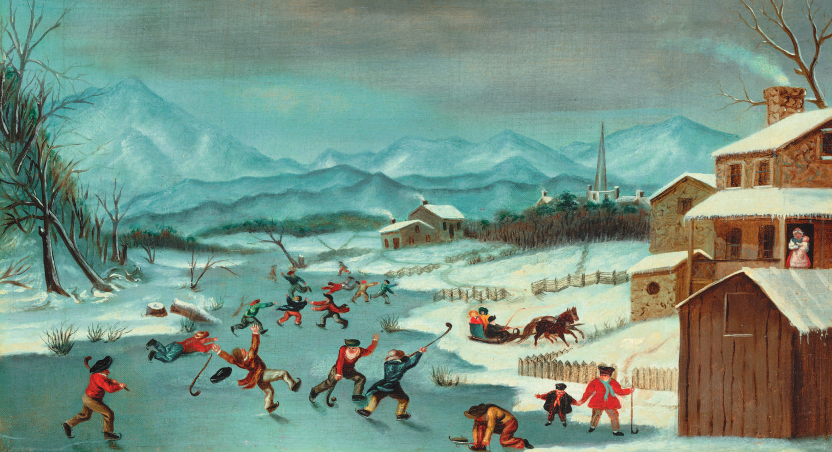
Картина американского художника Джона Тула «Сцена катания» (1835)

довая версия хоккея на траве в Англии охватывала уже солидный период.