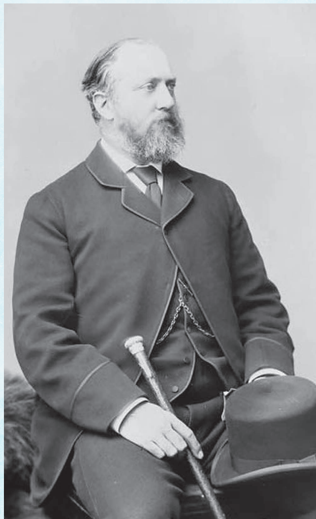
Лорд Фредерик Артур Стэнли

С 1910 года Кубок Стэнли оспаривали только профи. Возникла НХА — Национальная хоккейная ассоциация, которая просуществовала до осени 1917-го, а 22 ноября того же года в Монреале создали Национальную хоккейную лигу (НХЛ), которая со временем стала доминирующей силой в хоккее, объединив клубы Канады и США. С 1926-го Кубок Стэнли разыгрывают только команды НХЛ.