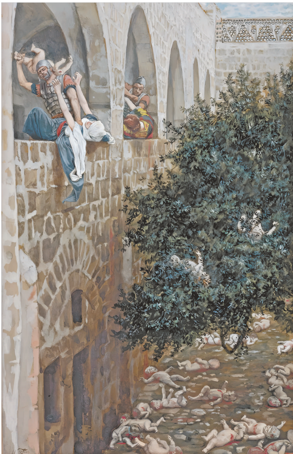
«...И послал избить всех младенцев в Вифлееме и во всех пределах его...» (Мф 2, 16).