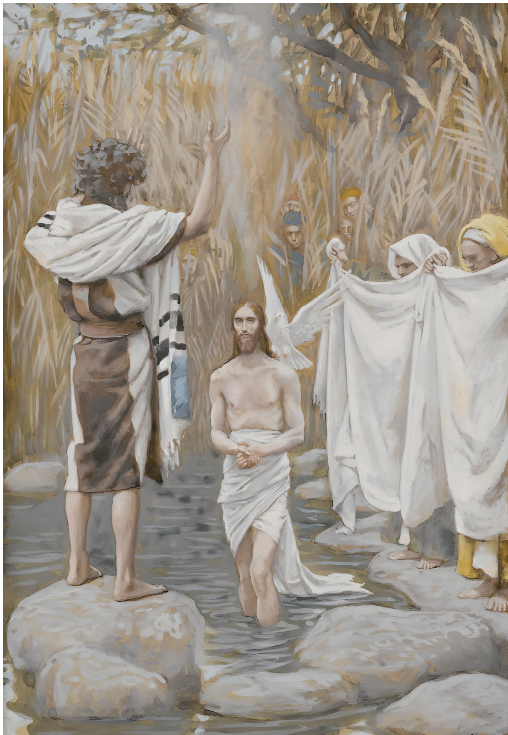
«И увидел Иоанн Духа Божия, Который сходил, как голубь, и ниспускался на Него» (Мф 3, 16).