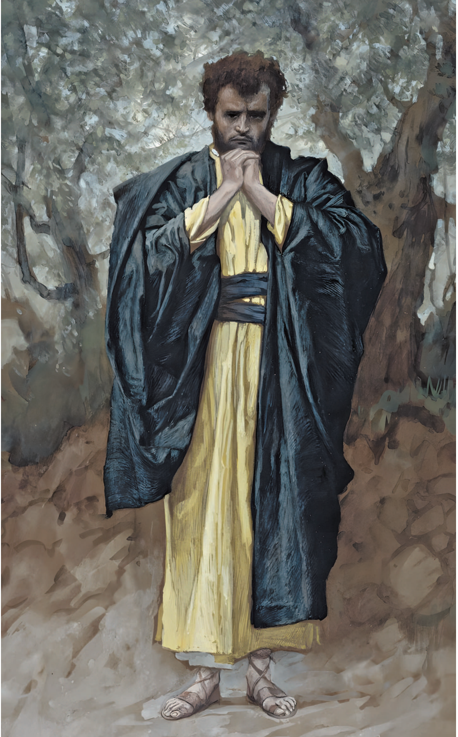
Святой апостол и евангелист Матфей.