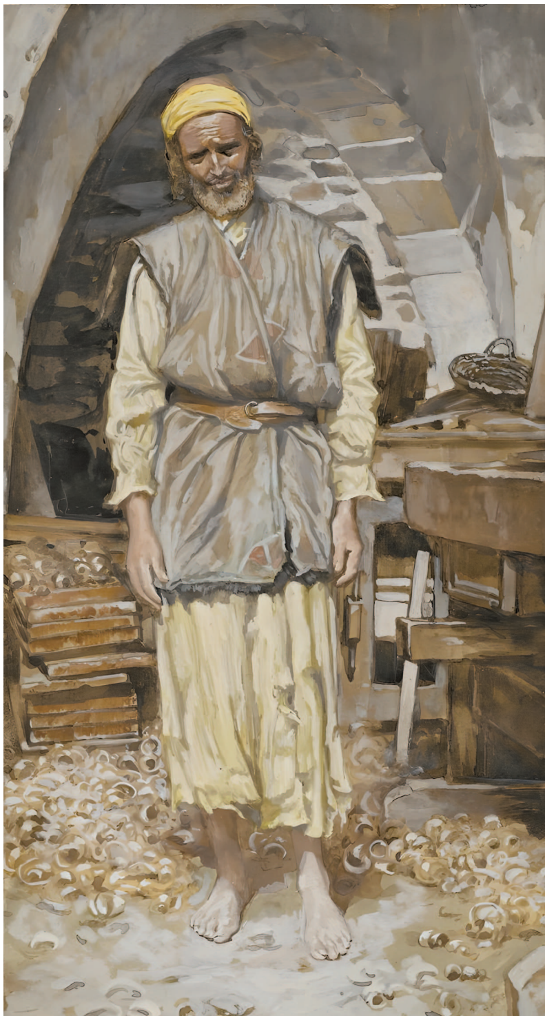
«Иосиф же муж Ее, будучи праведен и не желая огласить Ее, хотел тайно отпустить Ее» (Мф 1, 19).