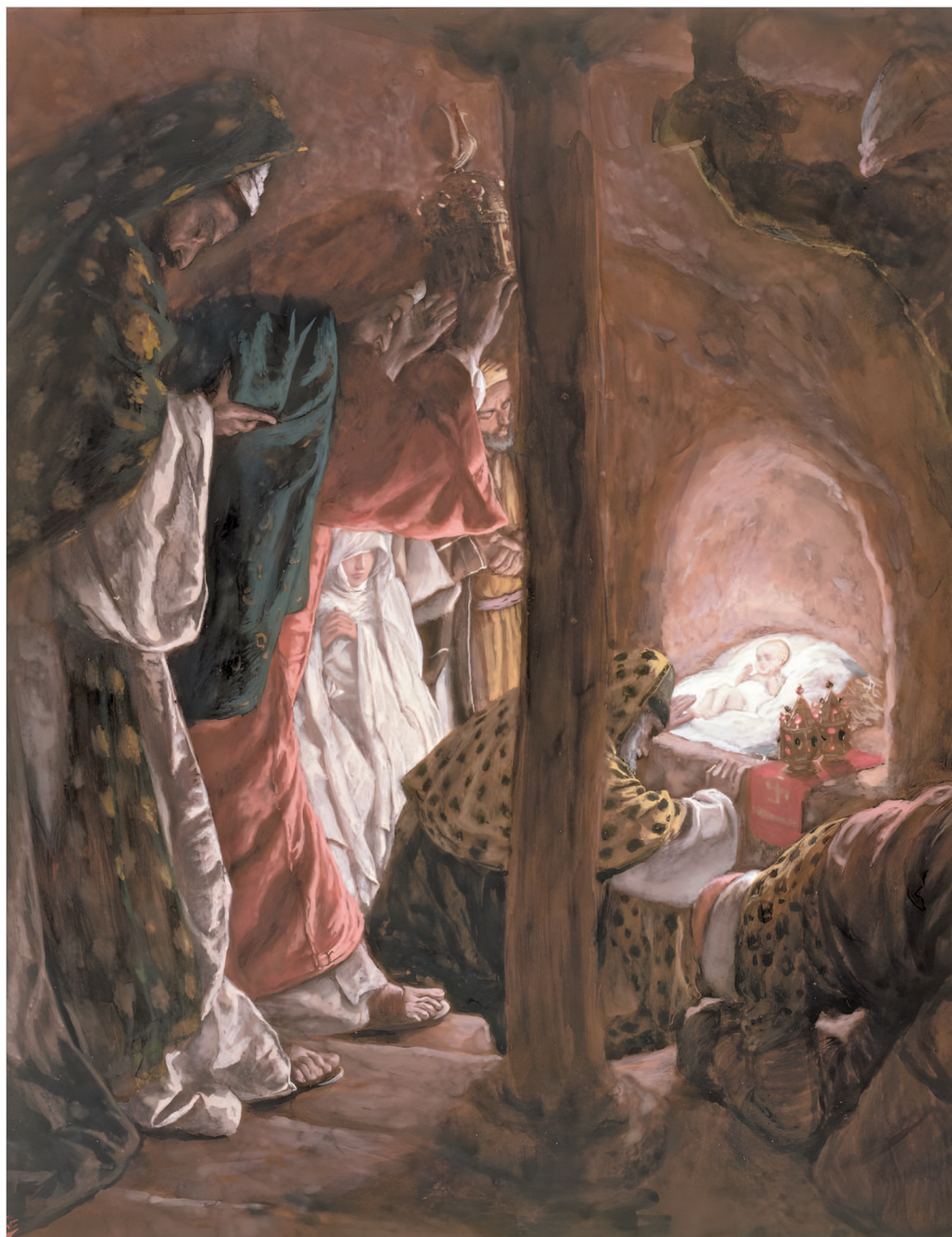
«...И, открыв сокровища свои, принесли Ему дары...» (Мф 2, 11).