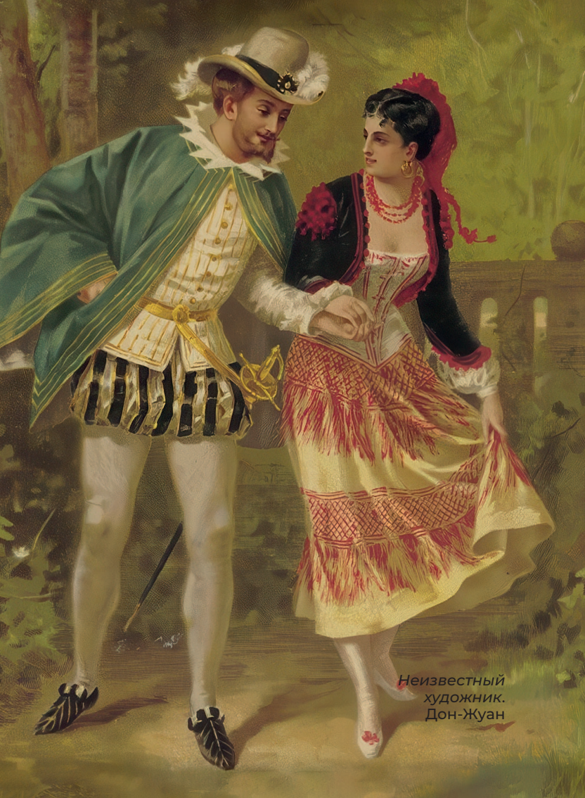
Неизвестный художник. Дон-Жуан