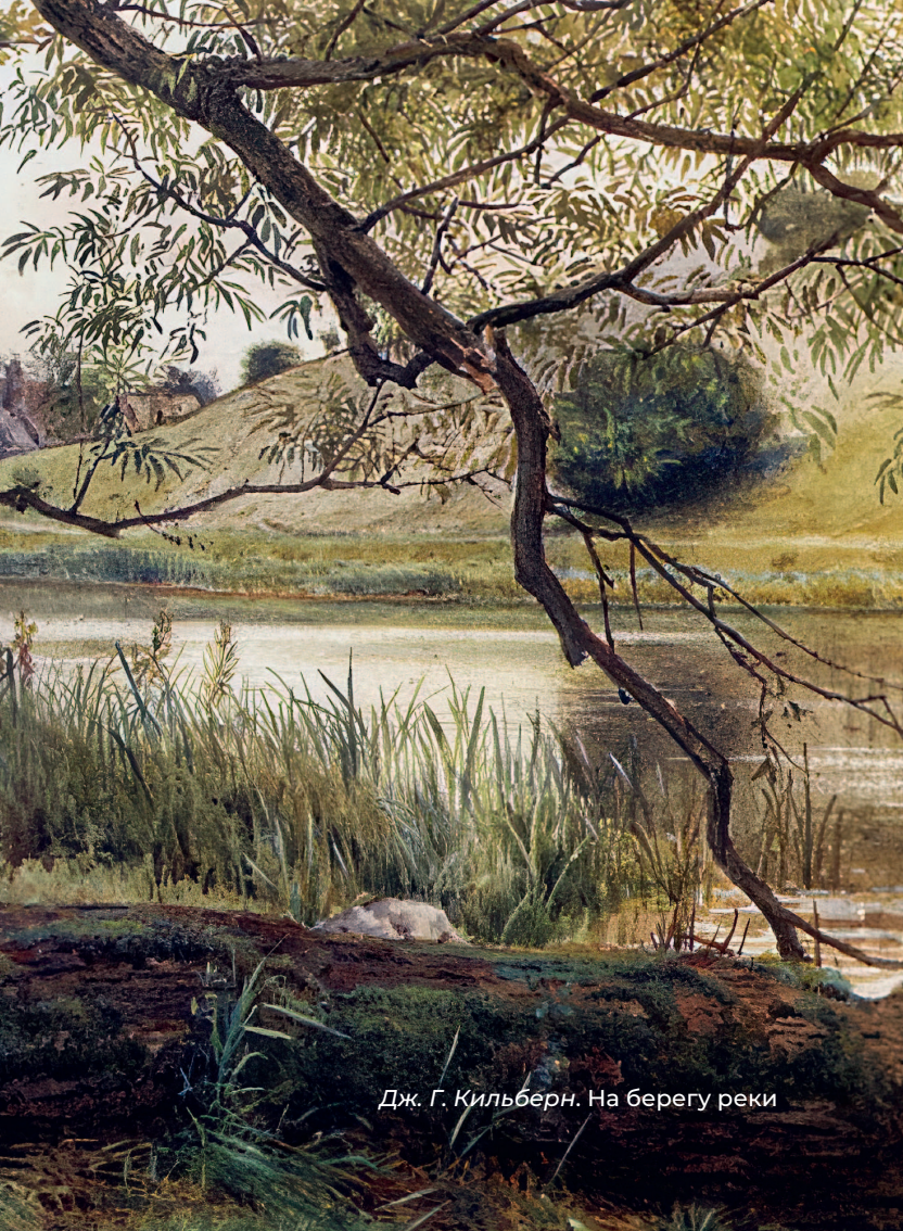
Дж. Г. Кильберн. На берегу реки