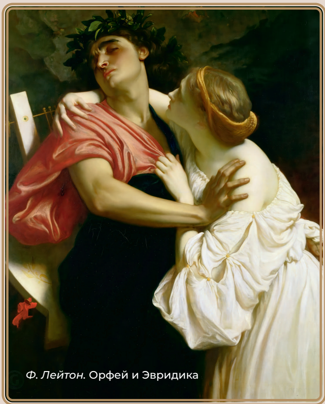
Ф. Лейтон. Орфей и Эвридика