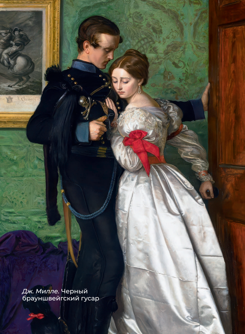
Дж. Милле. Черный брауншвейгский гусар