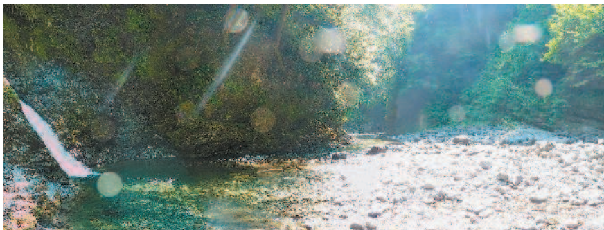
Орбы в ущелье реки Агвы

выше водопада уходит левее вверх. К деревьям привязана проволока. Держимся за нее. Затем по узкой тропе, хватаясь за корни деревьев. Чуть выше дорожка раздваивается: вверх — в лес и вниз — в каньон. Вверх уходит просека к тропе в верховья реки Агвы. Эта тропа пересекает ручей Сванидзе чуть ниже. Сейчас же нам направо-вниз. Выходим в каньон ручья Сванидзе. Здесь водопады и красивый грот. По правой стенке, чуть выше водного зеркала, проходим дальше. Скалы как ступени, по которым достаточно нетрудно идти. Аккуратно: бывает скользко!