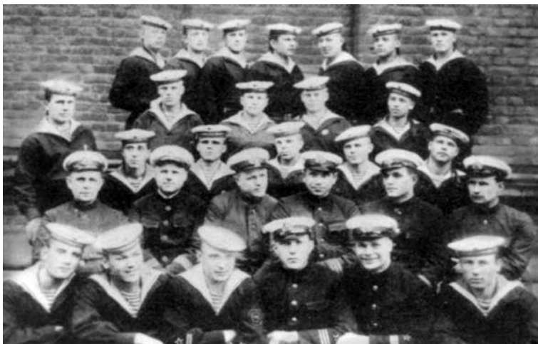
Учебный отряд подводного плавания Северного флота. 1937 г.

ма 1 . Занимался спортом, чтобы выдержать самую суровую проверку призывной комиссии. Врачи довольно равнодушно отнеслись к тому, что при росте 175 сантиметров я вешу 75 килограммов, имею значок ГТО второй ступени и справку активиста морского клуба Осоавиахима. Они придирчиво выстукивали и выслушивали сердце, легкие, кружили меня на каком-то вращающемся стуле, долго проверяли зрение и слух, пока наконец не вынесли приговор: годен к службе в Военно-морских силах.