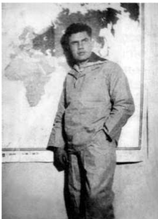
Война еще не началась. 1937 г.