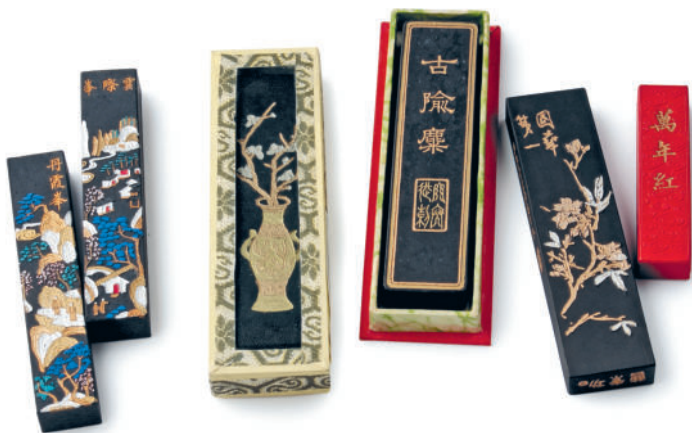
Бруски черной краски различных изготовителей. На каждом бруске указано имя изготовителя, или известные горы, или пейзаж

В китайском языке пиктограмма на письме пишется с мо , обозначающим черную краску. В большинстве живописных и каллиграфических работ используется этот цвет. Это связано с предпочтением китайцев использовать черную краску, что доказывают многие предметы истории. Восхищение черным составляет важную часть эстетических критериев предшествующих поколений.