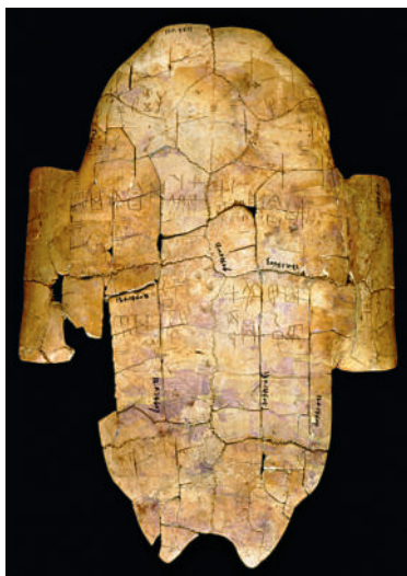
Шрифт цзягувэнь на панцире черепахи.

Независимо от выбранного стиля, начиная от выработанного пиктографического характера знаков и кончая свободным написанием курсивом, пиктограммы часто создают целые картины абстрактной красоты. Тушь должна течь с кисточки, как музыкальные знаки, гармонично плавая в потоке, смешанном с ритмом и мелодией. Таким образом, композиция отображает саму жизнь и захватывает зрителя.