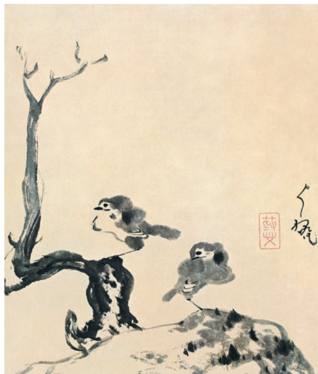
Чжу Да. Две птицы. Лист альбома. Тушь, бумага. 31,7 × 26,3 см. Частная коллекция.

Начиная с XIII в., параллельно с придворной живописью развивается неакадемизм, объединенный философией чань , или дзен . Одним из самых важных эстетических последствий было то, что ключевой стала линия, жест сам по себе обрел значение и превратился в объект изображения. Чжу Да (1625–1705) был одним из лучших представителей неакадемизма. Он писал все работы спонтанно, одной линией, по возможности без поправок. Он стремился при этом не воссоздать предмет, а подчеркнуть его внутреннюю энергию и простоту.