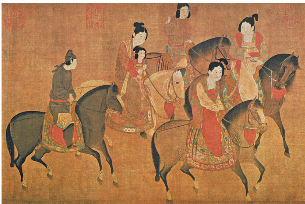
Копия картины Чан Шуань (VIII в.), приписываемая Ли Кон-линь (XII в.). Госпожа Го-го выезжает верхом на прогулку. Часть горизонтального листа. Черная тушь и краски, шелк. Национальный музей Императорского дворца (Тайбэй, Тайвань).