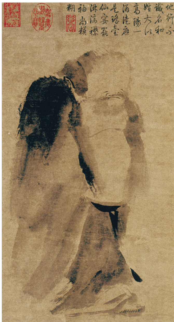
Приписывается Лян-кай. Бессмертный, или Чань-монах. XIII в., Южная Сун. Лист из альбома. Тушь, бумага. Национальный музей Императорского дворца (Тайбэй, Тайвань).

Последний жанр — люди, или персонажи. Речь идет о меньшем по значимости жанре, прижившемся благодаря индийскому влиянию и посвященном жанровому портрету человеческих качеств, без признаков реализма. Этот жанр наиболее древний, и вершина его расцвета пришлась на период Сражающихся Царств.