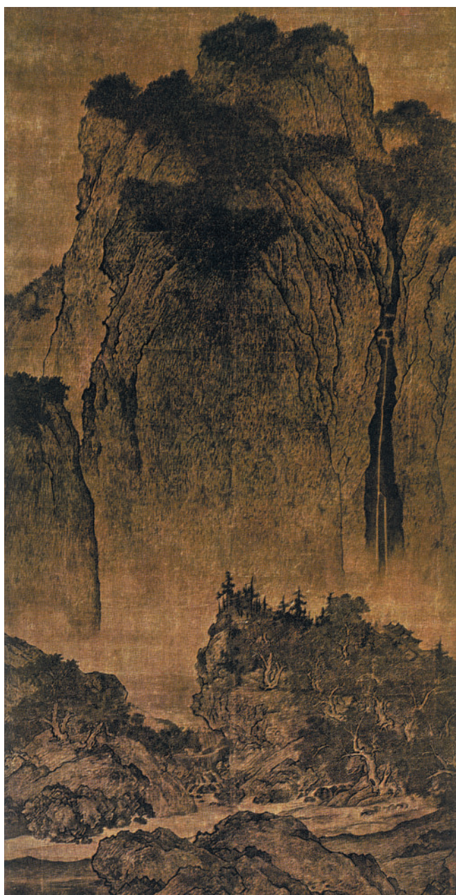
Фань Куань. Путники среди гор и потоков. Вертикальный лист. Тушь, светлая краска, шелк. Национальный музей Императорского дворца (Тайбэй, Тайвань).

Вначале пейзаж не был самостоятельным жанром, он служил фоном для других сцен; в пейзаже использовались прежде всего зеленые, голубоватые, позолоченные и темно-красные цвета. Изображение независимых пейзажей началось в эпоху династии Тан. Цветные краски были заменены монохромными гушевыми, что привело к существенному скачку в эстетике китайской живописи. Этот период предшествовал династии Сун, когда жанр утвердился благодаря художнику и критику Цзин Хао, который вместе со своими последователями Ли Чэном и Фань Куанем определил типологию жанра. В отличие от Запада, нарисованный пейзаж предназначен не для выставок, а для долгого уединенного созерцания и последующего осмысления.