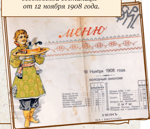
Меню ужина ресторана «Большой Московской гостиницы» от 12 ноября 1908 года.

➤ Более изысканным (но и дорогим!) получалось угощение с рябчиком. Вместо него можно было взять тетерку, куропатку или курицу. Мясо полагалось жарить, а не варить.