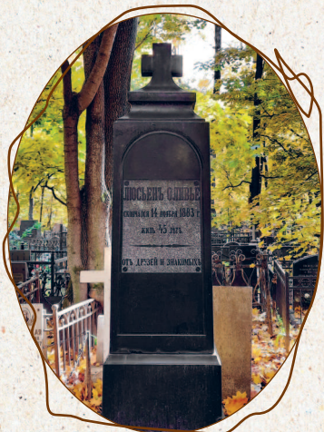
Могилы Люсьена Оливье.

14 ноября 1884 года Люсьен Оливье умер, похоронен он был на Введенском кладбище ( Наличная ул., 1 ). Сегодня к его могиле приходят все желающие найти работу в ресторанном бизнесе или достичь в этой сфере успеха. Ну а «Эрмитаж Оливье» оставался популярным и после смерти ресторатора. Несколько раз он перестраивался, менял фасад, приобрел общие залы для гостей, отдельные кабинеты и симпатичный летний сад. И в очередной раз подтвердил звание образцового учреждения, «которым Москва может и должна гордиться». Все так и было, даже столик свободный тут порой найти было сложно. Но только не почетным гостям. Любил это заведение актер Михаил Провович Садовский. Летом он ежедневно приезжал