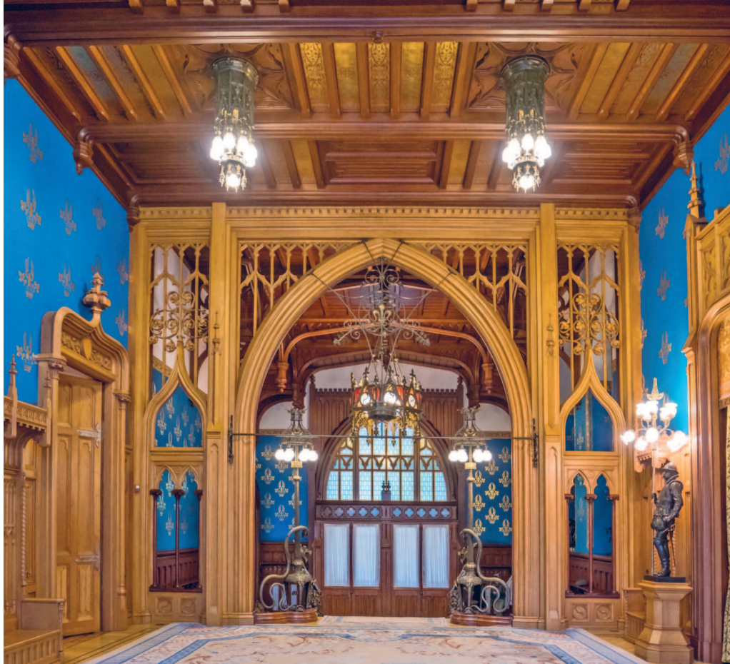
■ Аванзал в особняке Зинаиды Морозовой