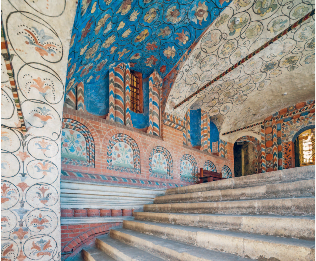
■ Росписи в Соборе Василия Блаженного

В XIV веке во время правления Ивана Калиты началось укрепление Московского княжества. Москва стала расти и строиться. Сооружались дворцы, церкви и палаты. Приняв великокняжескую власть, а также кафедру митрополита из Владимира, Москва переняла и владимиро-суздальскую домонгольскую архитектурную традицию. Московские зодчие переосмысливали Владимиро-Суздальскую школу и добавляли свои детали. Так появилась раннемосковская архитектура XV—XVI веков.