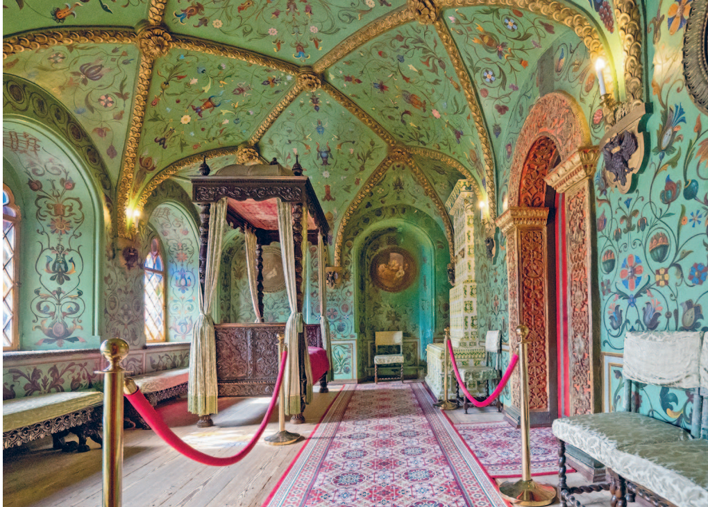
■ Палата Теремного дворца