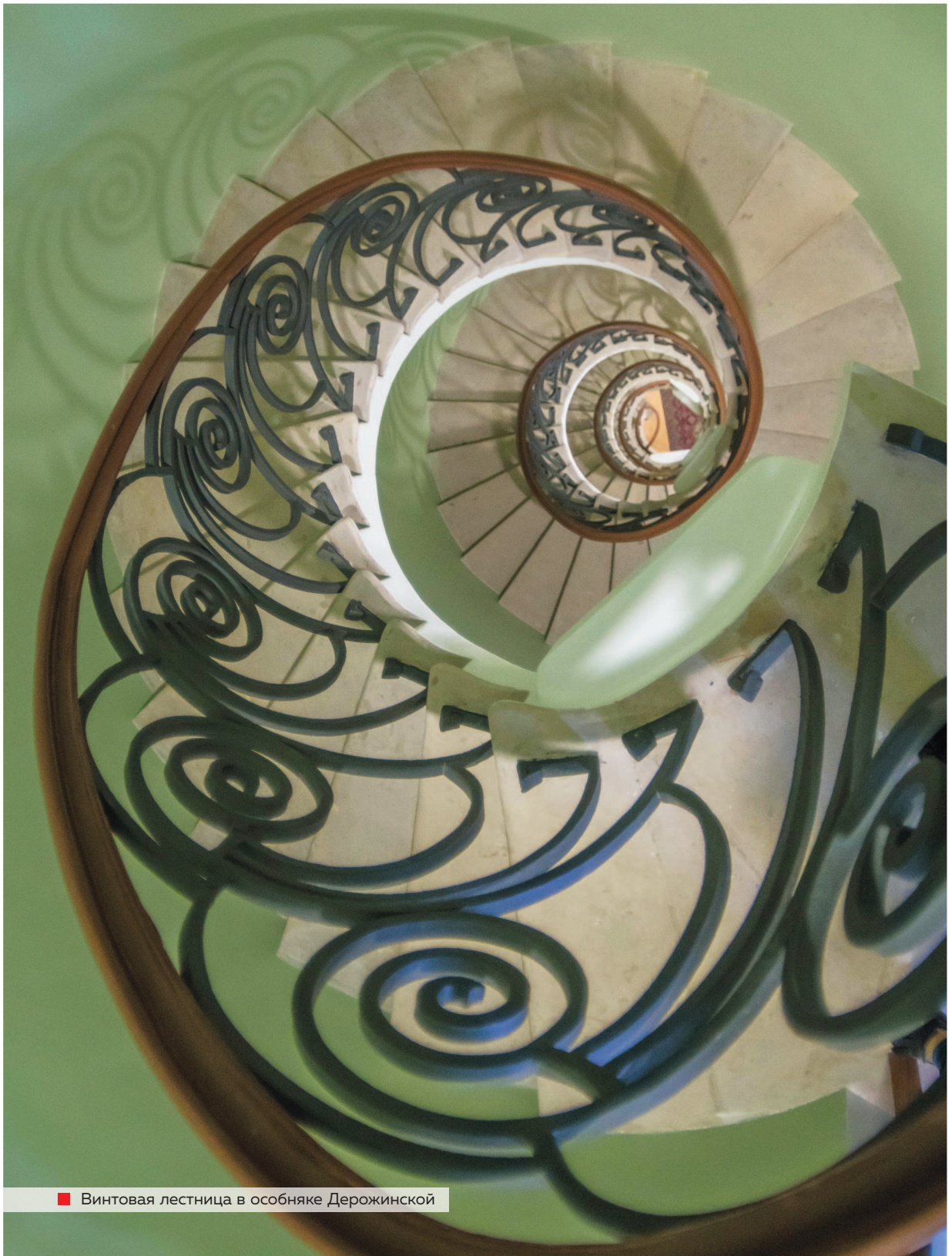
■ Винтовая лестница в особняке Дерожинской