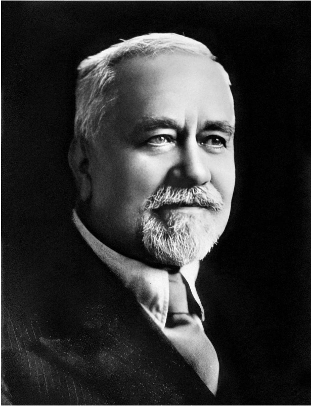
Леон Шарль Альбер Кальмет (12.07.1863–29.10.1933)

ла бактерия, которая в настоящее время поражает преимущественно морских львов и тюленей. Предполагается, что именно древние тюлени, а вовсе не средневековые европейцы занесли туберкулез на континент, а люди заболели из-за употребления в пищу зараженного мяса. «Захоронения» туберкулезной бациллы были обнаружены и в пирамиде Хеопса. Вот только невооруженным глазом бактерии не видны, поэтому раньше