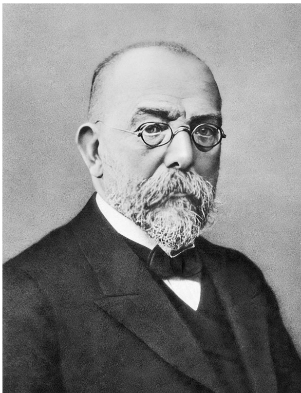
Генрих Герман Роберт Кох (11.12.1843–27.05.1910)

заболеваний, на фоне которых туберкулез развивается охотнее (ВИЧ, сахарный диабет, аутоиммунные заболевания), недостаточно здоровый образ жизни (однообразное и нерегулярное питание, стрессы, эмоциональные и физические перегрузки, недосып, вредные привычки).