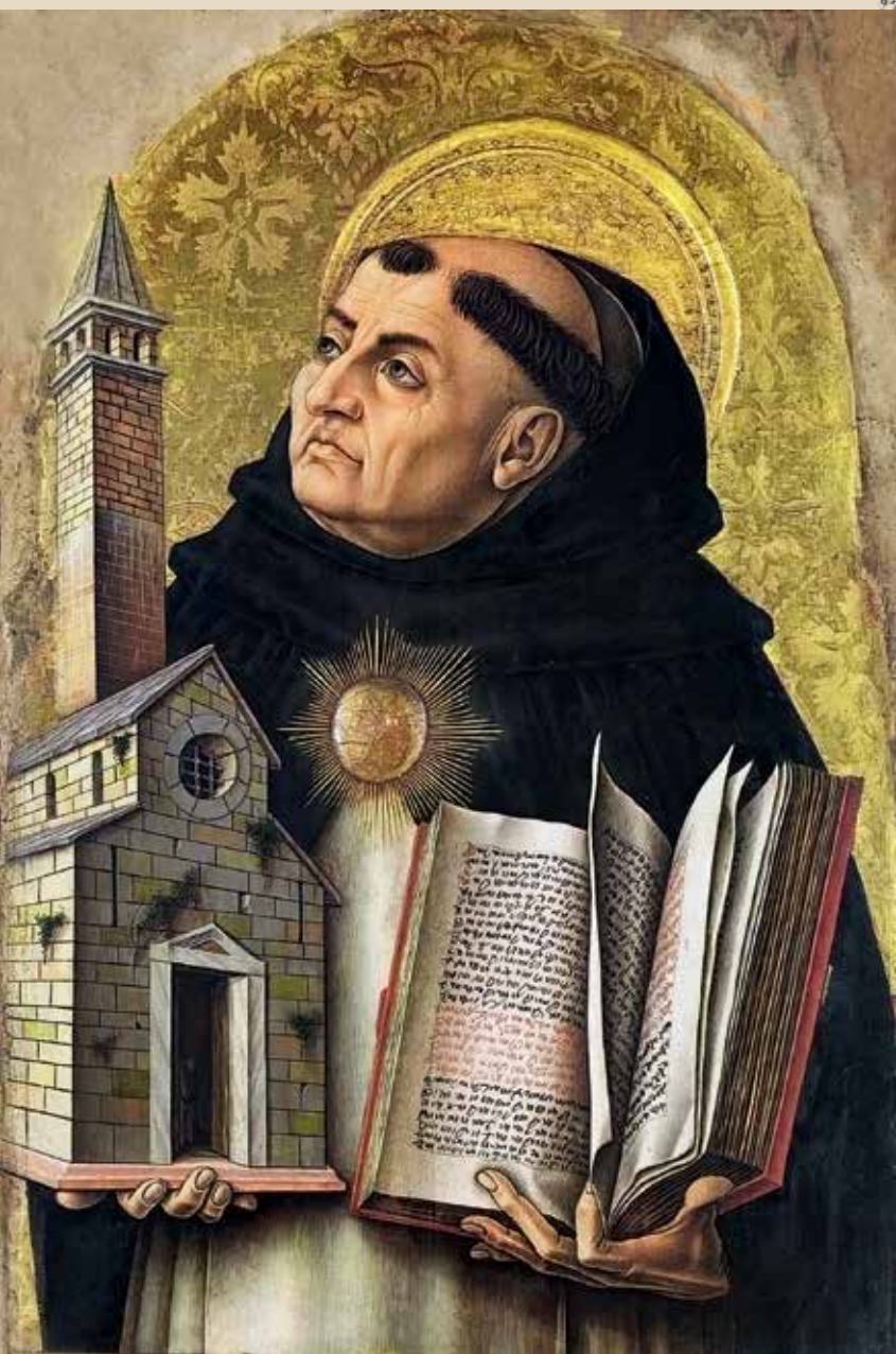
Карло Кривелли. Святой Фома Аквинский, покровитель всех католических учебных заведений и университетов. 1476