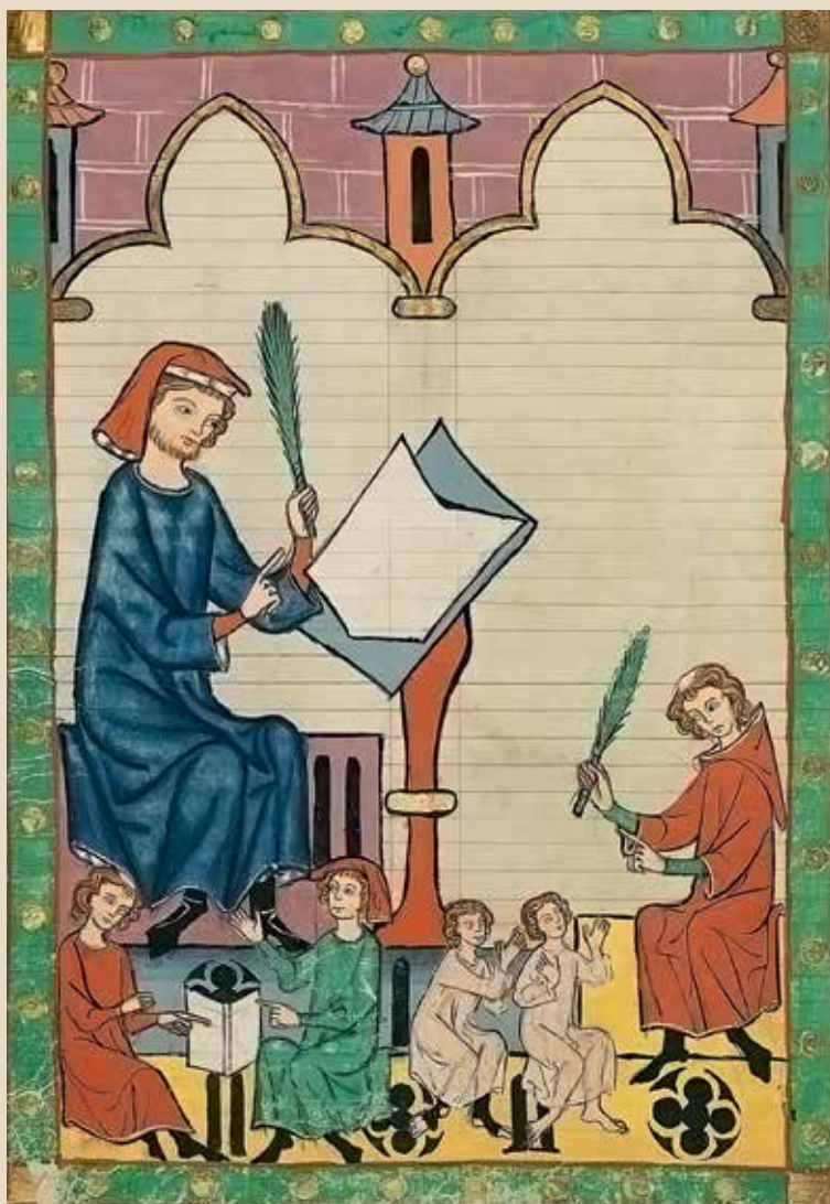
Студенты учителя из Эсслингена. Миниатюра из «Манесского кодекса». XIV век