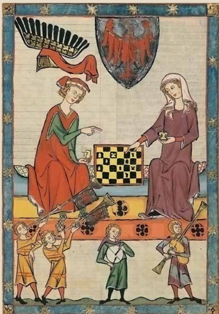
Игра в шахматы менестреля и его прекрасной дамы. Миниатюра из «Манесского кодекса». XIV век