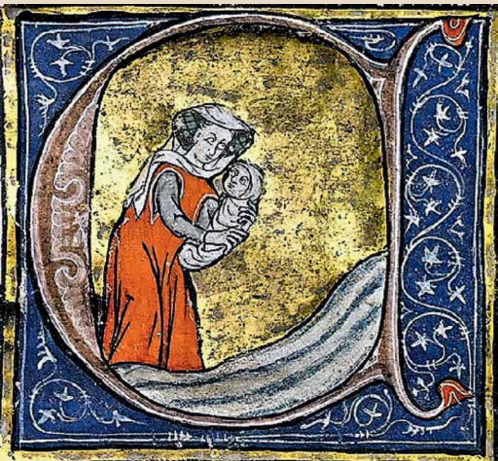
Дама с младенцем Ланселотом. Иллюстрация к рукописи «Грааль Рошфуко». XIII век