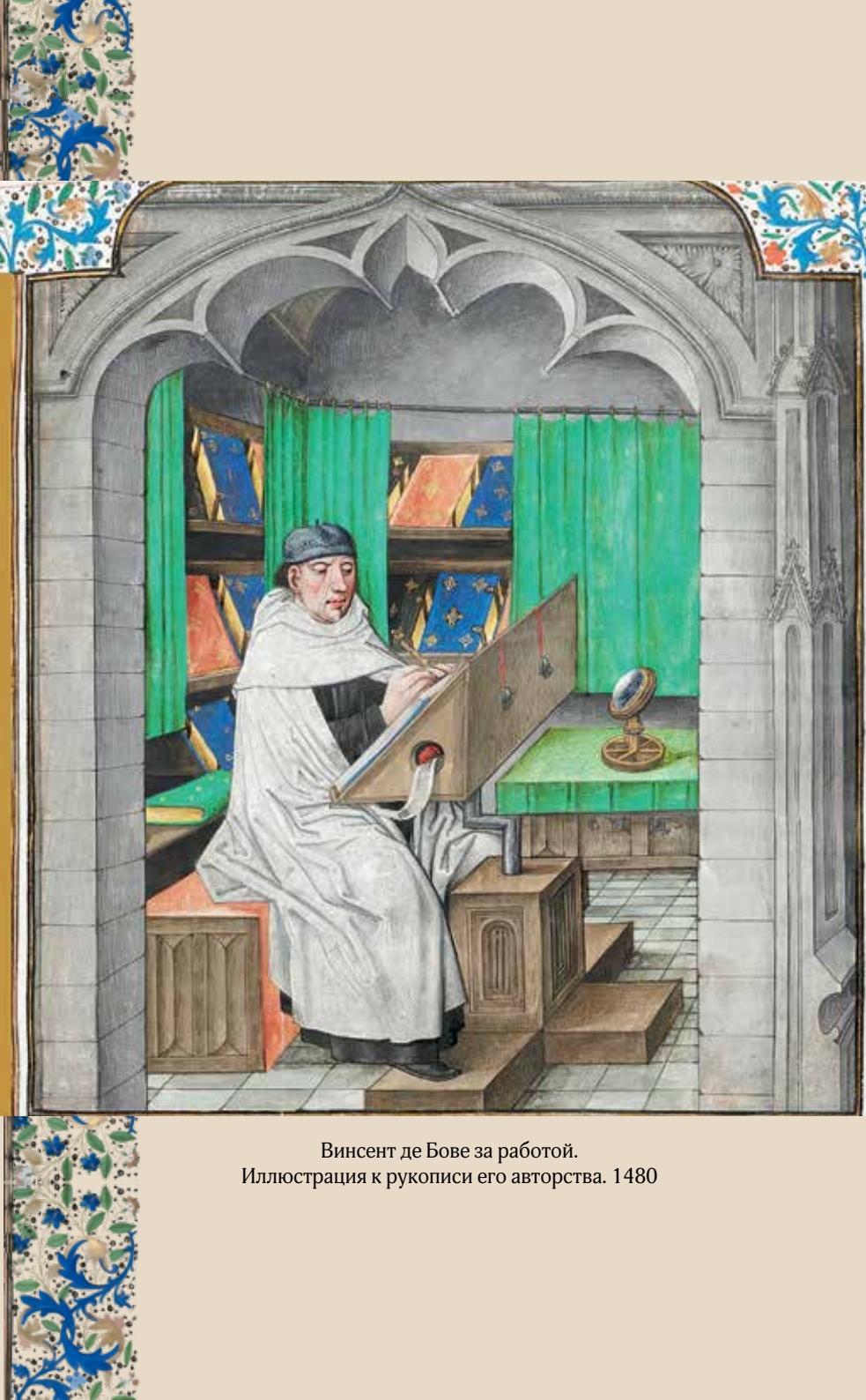
Винсент де Бове за работой. Иллюстрация к рукописи его авторства. 1480