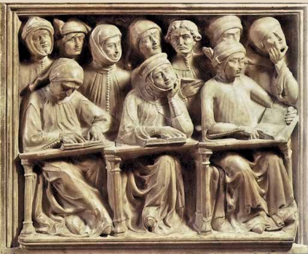
Студенты. Среди них присутствует девушка. Болонский университет. XIV век