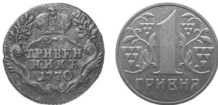
Российский гривенник 1770 года и современная украинская гривна

Параллельно с иноземными монетами на Руси использовались слитки различных размеров и форм. С течением времени они приобрели более или менее стандартный вид и стали известны как гривны. Это слово пережило века и используется до сих пор — правда, значение его не раз трансформировалось.