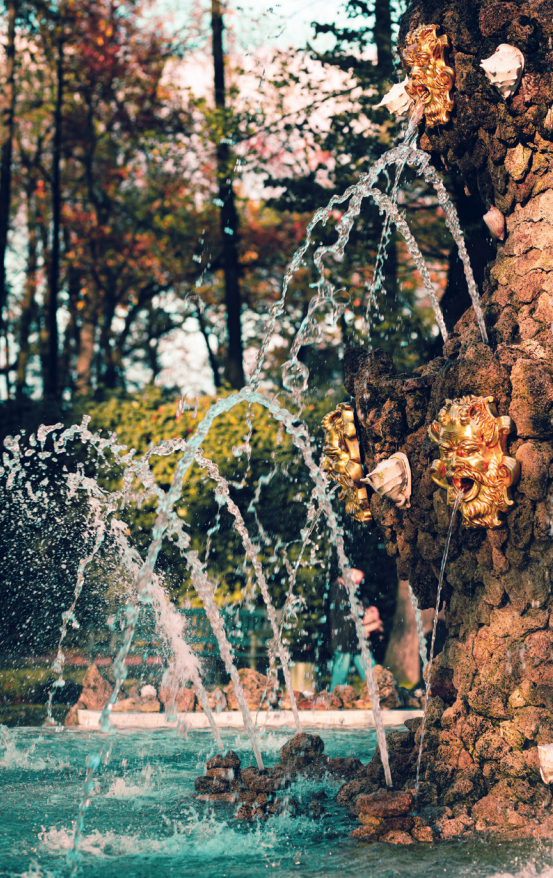
Фонтан «Коронный» в Летнем саду

почвами. Деревья высаживались круглый год. Работа кипела сутки напролет. В создании облика Летнего сада принимали участие лучшие зодчие не только России, но и Европы, такие как Жан-Батист Леблон, Михаил Земцов, Карл Росси, Бартоломео Растрелли. По замыслу Петра, парк должен был стать местом притяжения для всех знатных жителей новой столицы. Здесь устраивались роскошные балы и гуляния для дворянских семей. При Петре попасть в сад можно было только по приглашению, а его потомки постепенно превратили парк в достояние общественности, и сад стал доступен любому желающему. Теперь предлагаю неспешно рассмотреть постройки и детали Летнего сада.