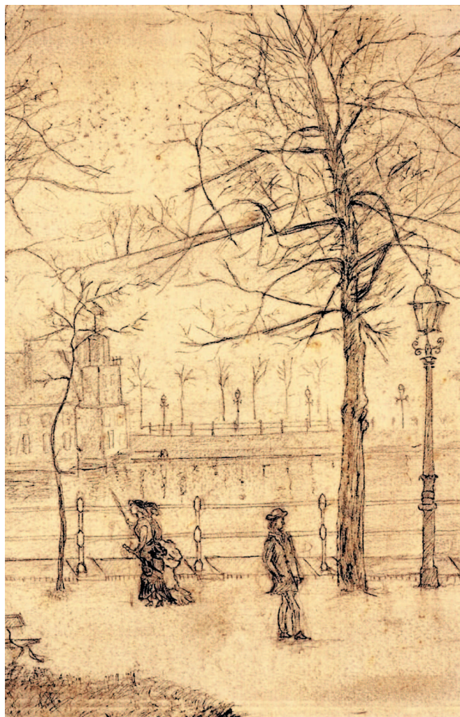
Ланге Вейферберг. 1872–1873