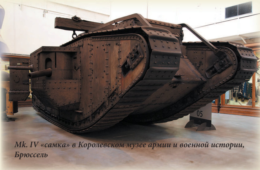
Mk. IV «самка» в Королевском музее армии и военной истории, Брюссель

Концепцию такой машины обосновал британский военный инженер подполковник Э. Суинтон. По его мнению, она должна быть самоходной, иметь противопульное бронирование и спо-