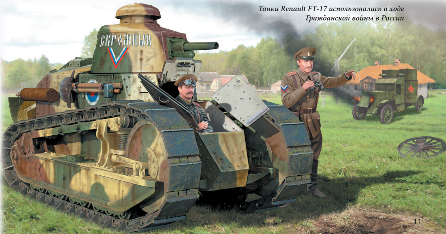
Танки Renault FT-17 использовались в ходе Гражданской войны в России