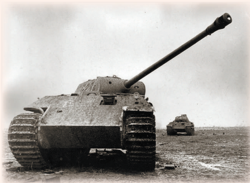
Брошенные на Курской дуге «пантеры» первых серий. Их многочисленные технические дефекты сильно затрудняли эксплуатацию в войсках

тривающем рассмотрение характеристик машины в контексте их реального боевого использования, ответ становится просто очевидным. Обратной стороной технического «совершенства» «пантер» и «тигров» стали их высокая стоимость и сложность в производстве. В такой ситуации промышленность Третьего рейха просто не могла их производить в достаточных для потребностей войск количествах. Как бы ни был хорош один отдельно взятый танк, его все равно нельзя использовать одновременно на двух участках фронта! Недаром почти вся история Панцеваффе, начиная с 1943 года, в большинстве случаев сводится к судорожным метаниям вдоль линии фронта в лихорадочном стремлении закрыть многочисленные бреши в обороне, в которые стальным потоком вливались пусть менее совершенные с технической точки зрения, зато лучше приспособ-