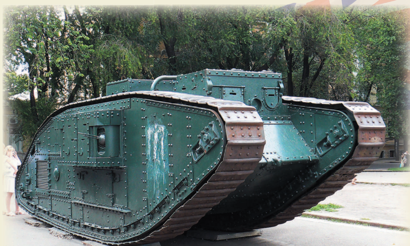
Мк. V, захваченный Красной Армией на Каховском плацдарме

Расположенный в центральной части корпуса двигатель и высокий гусеничный обвод практически исключили возможность установки вооружения во вращающейся башне. Однако поставленные перед машиной задачи требовали широкого сектора обстрела. Поэтому вооружение разместили в бортовых спонсонах. Чтобы уменьшить габариты для перевоз-