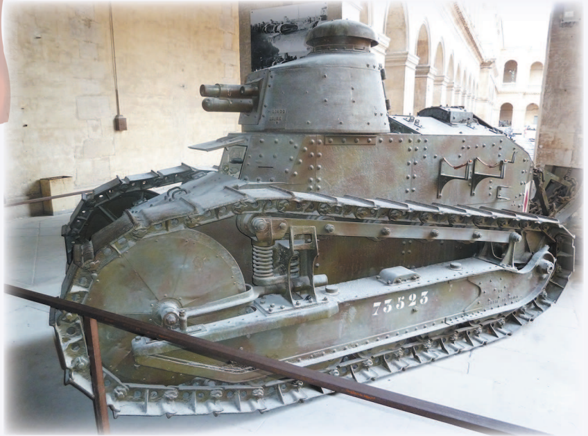
Пушечный вариант Renault FT-17

Renault FT-17 выпускался в четырех вариантах. В первых