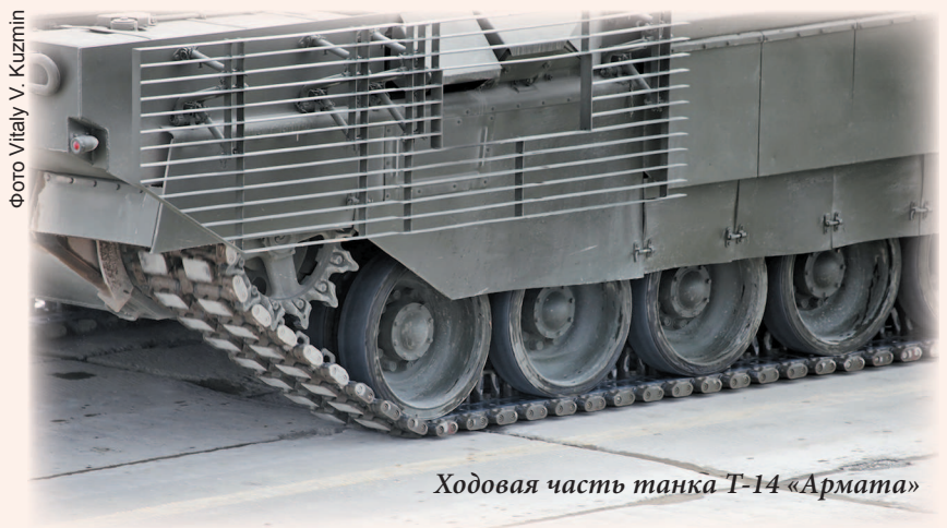
Ходовая часть танка Т-14 «Армата»

Изюминкой конструкции стал комплекс активной защиты «Афганит». С помощью специального радара отслеживаются все летящие по направлению к танку объекты. Определив скорость, направление и размер объекта, система разворачивает устройство и подрывает заряд в направлении угрозы. Сформировавшееся ударное ядро способно поразить любой летящий со скоростью до 1700 м/с объект на расстоянии 4–5 метров от танка. Таким образом, обеспечивается уничтожение на подлете не только противотанковых ракет, но и изменение