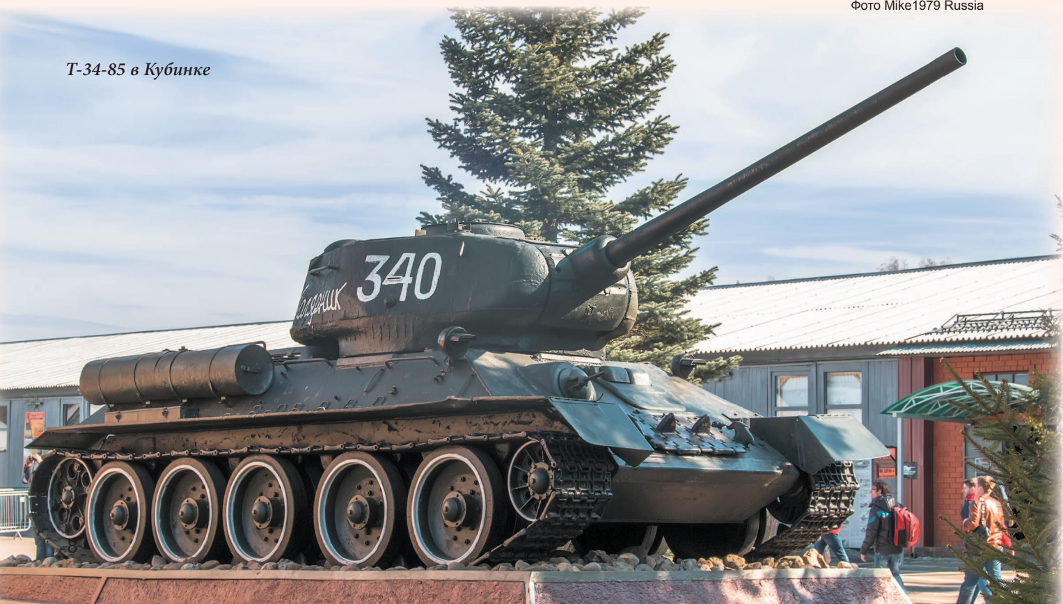
Т-34-85 в Кубинке