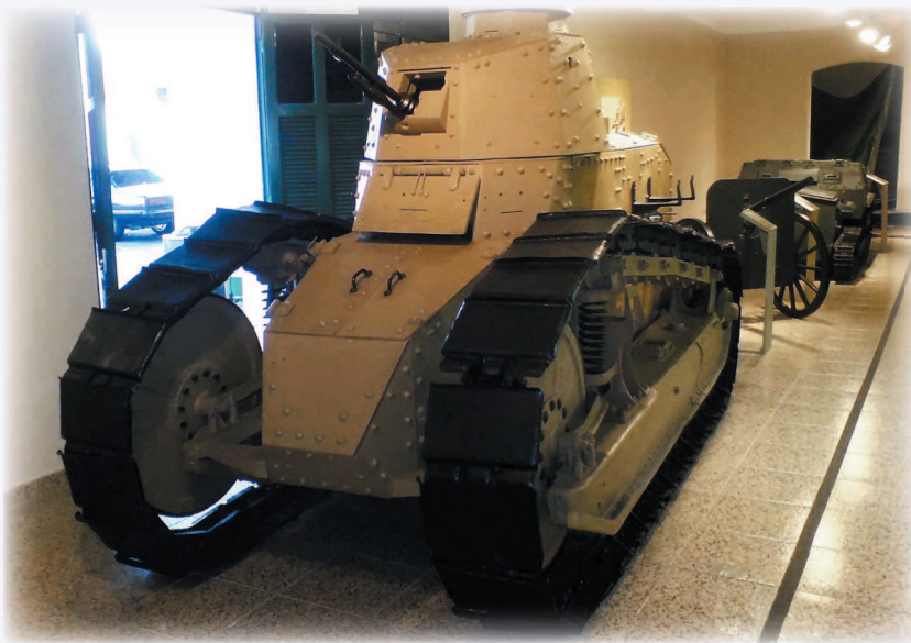
Пулеметный вариант Renault FT-17

стали США. Американская армия получила 514 машин французского производства и с успехом применяла их в боях сентября-ноября 1918 года. После войны танк закупали Бельгия, Бразилия, Канада, Китай, Япония, Испания, Голландия, Польша и ряд других стран.