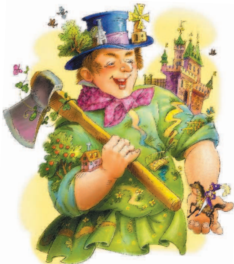
Рисунки Г. Соколова