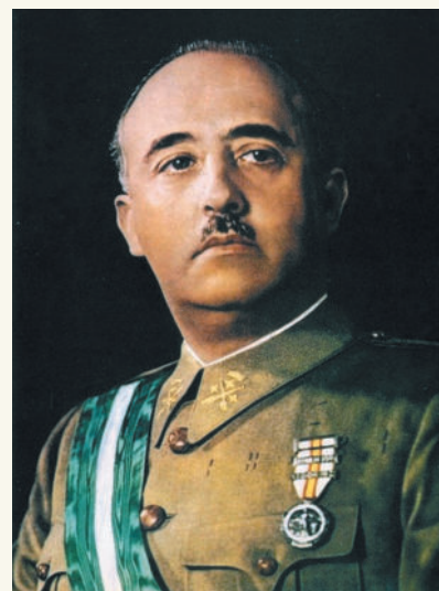
■ Диктатор Испании Франсиско Франко (1939–1975).

Заметные группировки правых сил в 1930-е гг. возникли в Бельгии и даже в Великобритании, впрочем, для захвата власти их влияния оказалось недостаточно. В Скандинавии кризис был преодолен в спокойной обстановке, благодаря системе скандинавского социализма, обеспечившего справедливый раздел недавних доходов от торговли с Германией между всеми членами социума. При этом расовая пропаганда нацистов привела к формированию значимых ультраправых группировок в Норвегии.