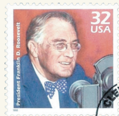
■ Почтовая марка. Портрет Ф.Д. Рузвельта

«Настоящая личная свобода невозможна без экономической безопасности и независимости. Голодные безработные люди — это кадры для диктатуры». Франклин Рузвельт