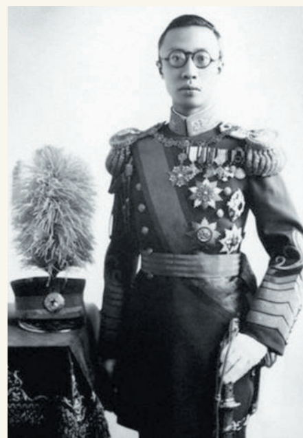
Верховный правитель Маньчжоу-Го — Пу И.

Японская экспансия была временно приостановлена. Готовясь к новым захватам, японцы приступили к переоснащению вооруженных сил.