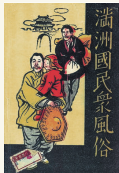
■ Открытка. Из жизни крестьян в Маньчжоу-Го.

В ответ ослабленный и лишенный единства Китай прибег к бойкоту японских товаров. Успех операции и пассивность великих держав вдохновили японцев на расширение агрессии. Стремясь монополизировать внешнюю торговлю Китая, японский