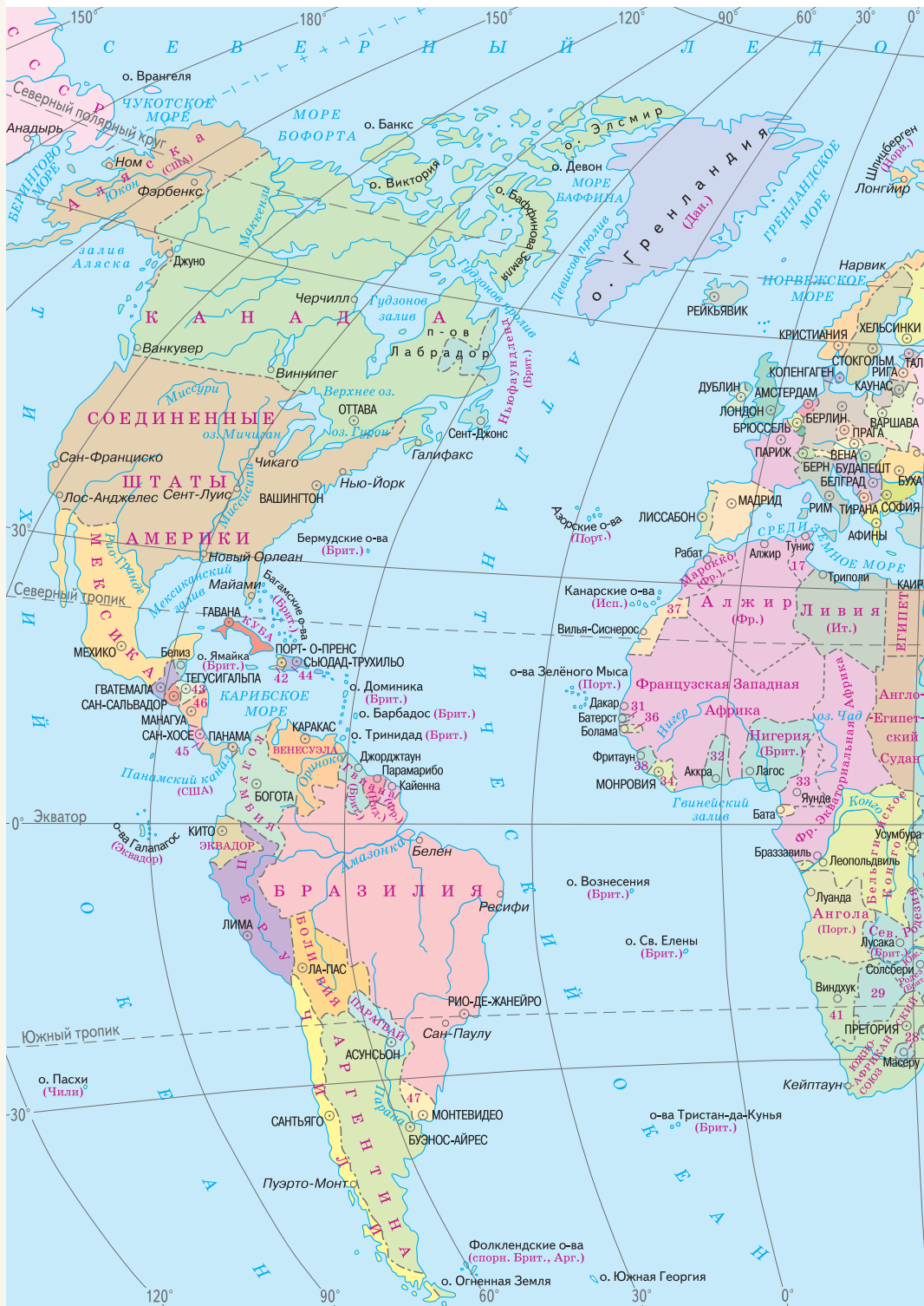
ПОЛИТИЧЕСКАЯ КАРТА МИРА на 1923 г.

--- Границы государственные Границы государств показаны по состоянию на 1923 г.