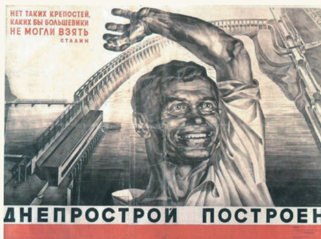
■ Советский агитационный плакат. «Днепрострой построен». 1932 г.

Германия, лишившись притока средств, прекратила репарационные платежи, а ее хозяйство скатилось в глубокую депрессию. К 1932 г. более 8 млн немцев лишились рабочих мест.