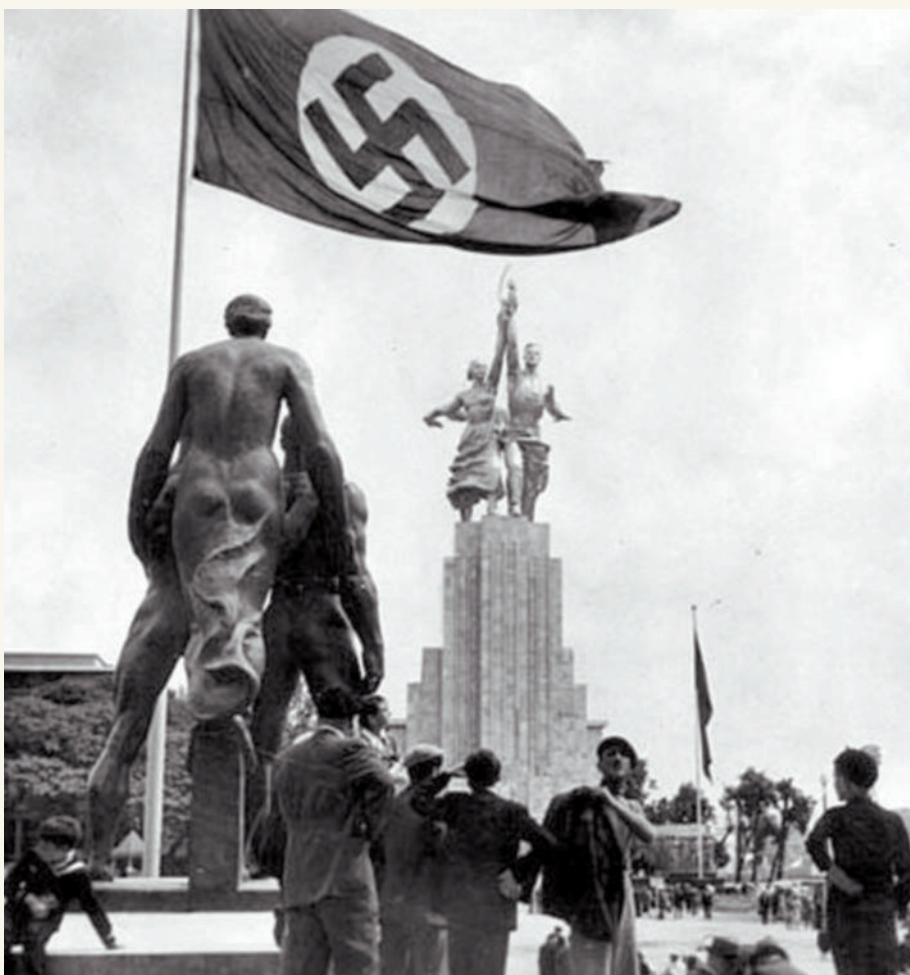
■ Всемирная выставка в Париже 1937 г. Экспозиция гитлеровской Германии располагалась напротив советского павильона.

легче. Наличие имперских владений позволяло переложить часть проблем на плечи колониальных народов. Тем не менее правая волна чуть не захлестнула Францию. В феврале 1934 г. более миллиона сторонников националистических и фашистских объединений попытались захватить власть. Политическая ситуация в стране была стабилизирована лишь на платформе Народного фронта — объединения либерально-демократических и левых сил.