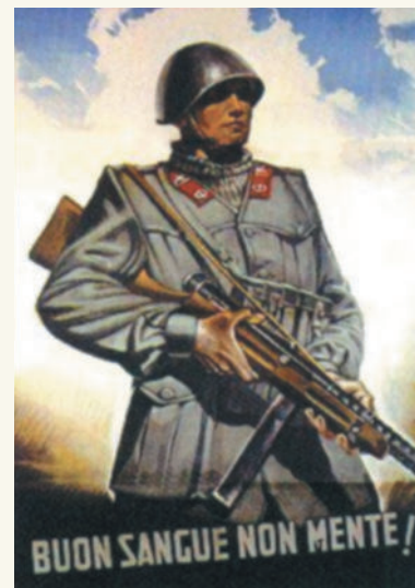
■ Итальянский агитационный плакат. «Buon sangue non mente!»

Летом 1934 г. Муссолини предотвратил попытку Гитлера захватить Австрию. Данный факт вызвал закономерное одобрение Франции, пожелавшей отплатить итальянцам за труды. Французский министр П. Лаваль намекнул Муссолини, что Франция снисходительно относится к очередной итальянской попытке захватить Абиссинию. Имевшую насущные интересы в регионе Англию новые партнеры в известности о договоренности не поставили. Муссолини начал подготовку к аннексии, продолжавшуюся около года.