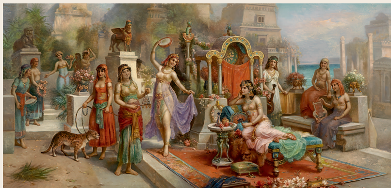
Жан-Фредерик Вальдек. Висячие сады Семирамиды. XX век

историей Древнего Востока мы знакомимся с самого раннего возраста: для нас это первые, почти мифические сказания о том, как жили люди в древности и как создавались первые города, появлялись целые цивилизации. Мы помним и о чудесах, которые связаны с древними государствами, — о египетских пирамидах или Висячих садах Семирамиды 1 , а также о легендарных грандиозных событиях: Великом потопе или, например, о крушении Вавилонской башни. В нашем восприятии часто эти события кажутся близкими друг другу, хотя на самом деле их разделяют огромные временные отрезки, составляющие многотысячелетнюю историю Древнего мира.