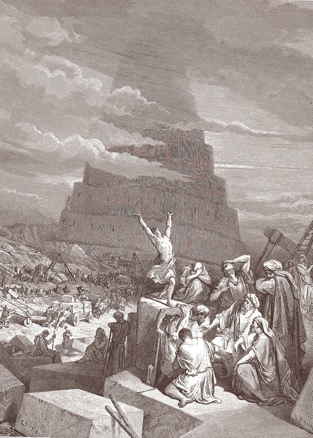
Гюстав Доре. Смешение языков. 1868