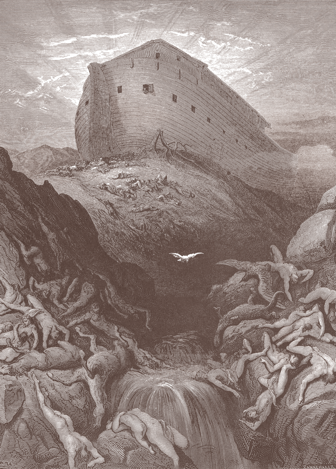
Гюстав Доре. Голубь, выпущенный из ковчега. 1850