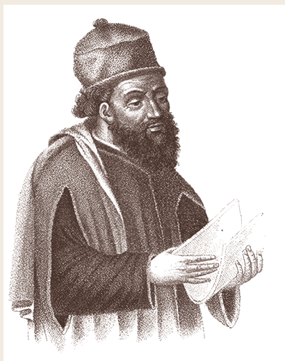
Портрет Диодора. Издание Biblioteca storica di Diodoro Siculo. 1821