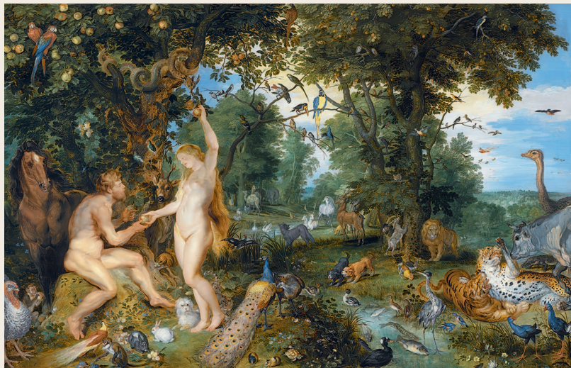
Ян Брейгель (Старший) совместно с Питером-Паулем Рубенсом. Адам и Ева в райском саду. 1615

мыслиния своего места в мире. Например, для древних египтян Восток ассоциировался с пустыней, известной как Хентет-Иабет, что означало «перед Востоком» или «предшествующая Востоку» 1 . В египетской мифологии для этого была своя богиня востока и восточной пустыни — Иабет (Абет).