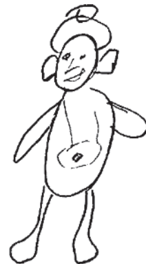
Рис. 3. Человек