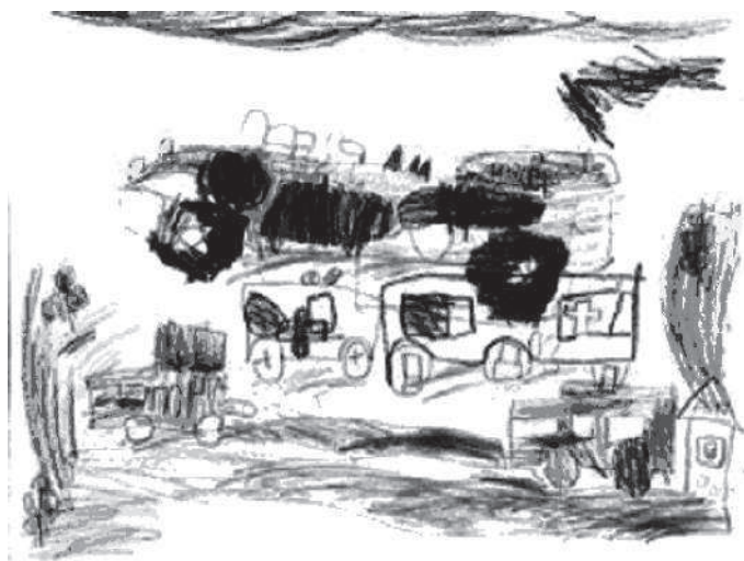
Рис. 5. Война