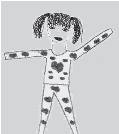
Рис. 6. Девочка в спортивном костюме

Причем мальчики пяти-шести лет активно рисуют панорамы военных действий ( рис. 5 ), изображают кровавые сцены, проявляют интерес к рисованию комиксов. Девочки чаще всего рисуют красивых девушек и куколок в различных нарядах ( рис. 6 ).