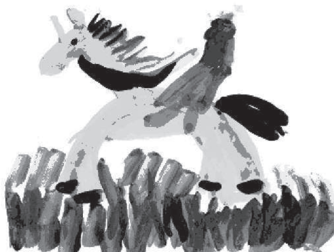
Рис. 4. Лошадка