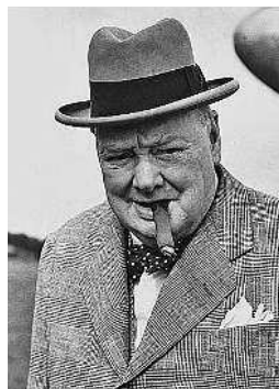
Бульдожья челюсть Уинстона Черчилля выдавала его звериную хватку

Известно, что именно китайцы достигли значительных результатов в развитии физиогномики – искусства чтения по лицу. Первые трактаты об этой науке появились в этой стране еще в X веке. Вообще, в какой-то степени все люди физиономисты. Любой из нас даже не задумывается о том, как часто произносит фразы вроде: «У него честное лицо» или «Мне не нравится его взгляд». Один из самых ярких примеров, иллюстрирующих, как черты лица могут раскрыть свойства личности, – Уинстон Черчилль. Он имел бульдожью челюсть, и люди ощущали в нем цепкость бульдога, которую он и проявлял.