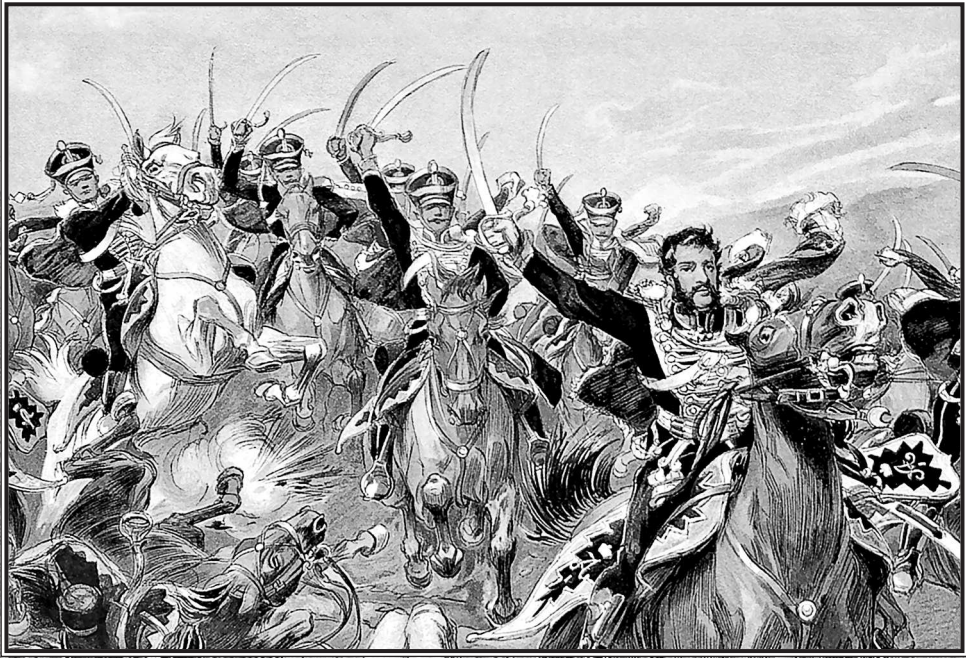
Н. С. Самокиш. Атака русской кавалерии у деревни Клястицы. Эпизод Отечественной войны 1812 года.