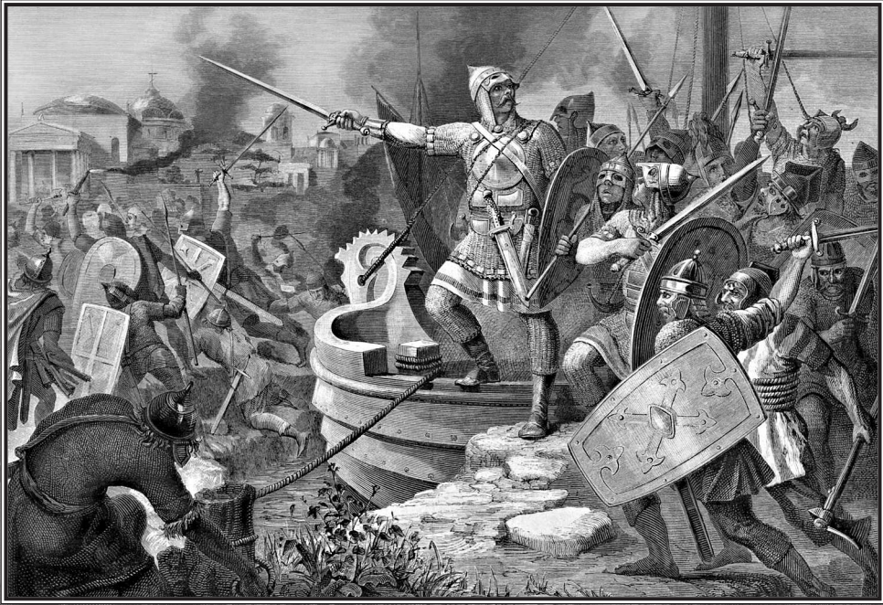
Великий князь Олег под стенами Константинополя в 906 г. Дружина князя высаживается на берег.

Гравюра из журнала «Всемирная иллюстрация» 1878 г.