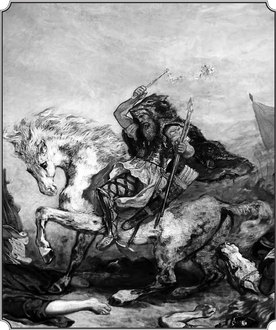
Эжен Делакруа. Аттила. Фрагмент. 1840-е гг.

После Великого западного похода* улус расширился на запад, его центром стало Нижнее Поволжье. В 1251 году в столице Монгольской империи Каракоруме состоялся курултай, где великим ханом был провозглашен сын Толюя — Мункэ (Менгу). Герой Западного похода Батый, «старший в роде» (ака), поддержал Мункэ, рассчитывая получить полную автономию для своего улуса.