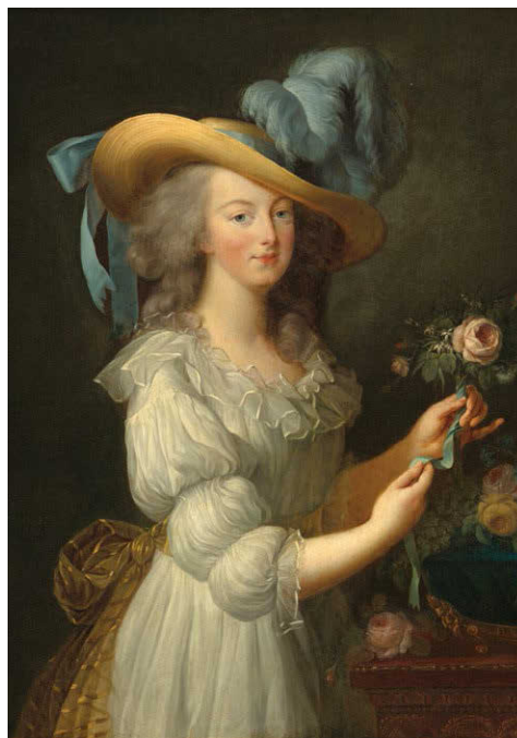
Мария-Антуанетта. Неизвестный художник. По мотивам портрета Элизабет Виже-Лебрён. Холст, масло. 92,7×73,1 см. После 1783

Я думаю, вам интересно узнать, когда и почему два диаметрально противоположных