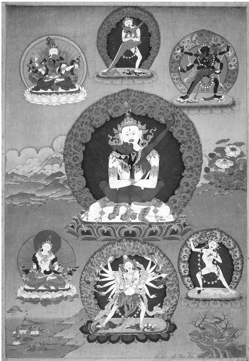
Белый Чакрасамвара, из серии «Двадцать семь божеств-хранителей» Ситу, провинция Кам, 18 в.