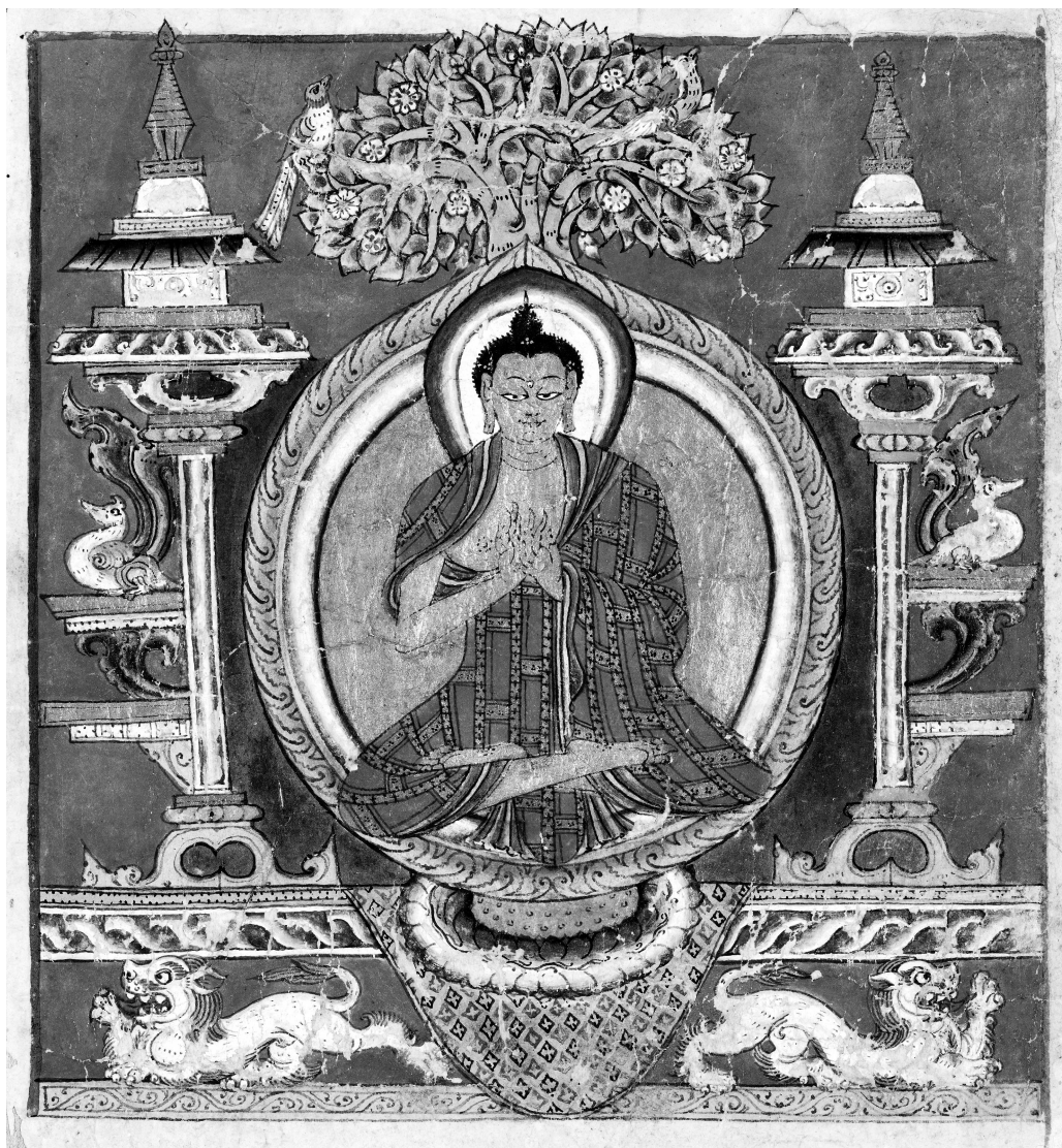
Молящийся Шакья Муни, монастырь Толинг, 11 в.