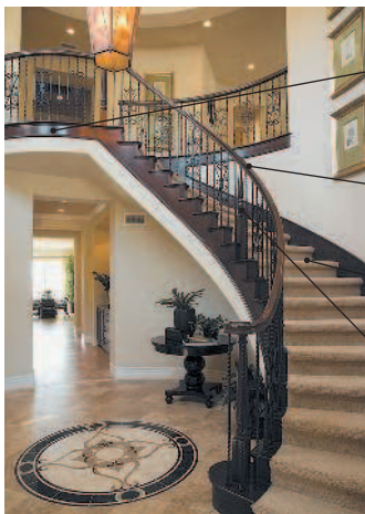
landing лестничная площадка