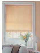
roller blind штора